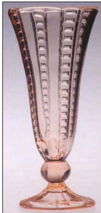
Abb. 2010-2/205 Vase „Erika“ (Pressglas) Saarglas, Fenne um 1935

Im Herbst 2010 wird es eine Ausstellung von Kerzenleuchtern aus Pressglas geben. Ergänzend werden den Besuchern jeweils aktuelle Neuerwerbungen und Leih-