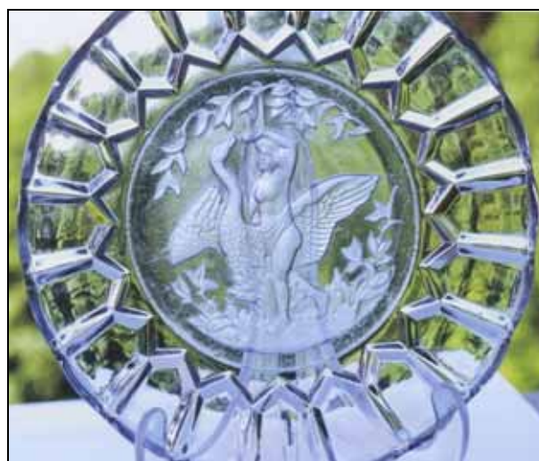
Abb. 2010-3/125 →