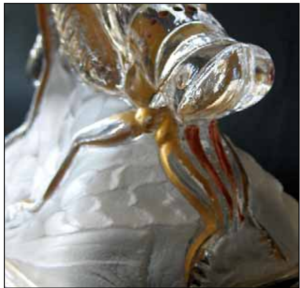
Abb. 2004-4/079a (Ausschnitt aus Abb. 2004-4/084) Vase mit einer Heuschrecke MB Baccarat 1870, Planche 306, Vasen, No. 5376, H 216 mm