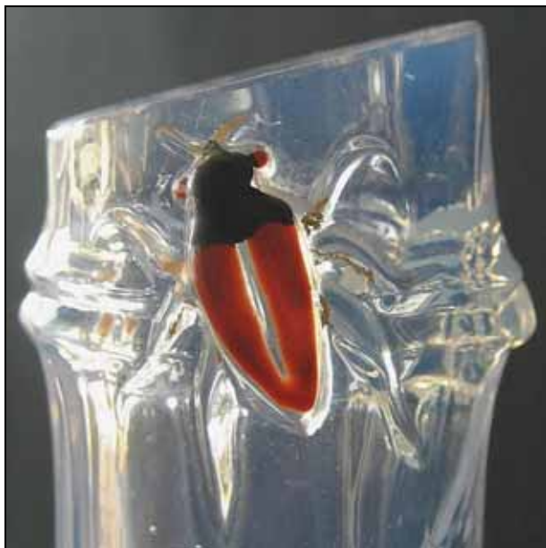
← Abb. 2007-3/162

Vase mit einer Schlange farbloses, opalisierendes Pressglas, H 21,3 cm, D 10,5 cm Sammlung Vogt unter dem Boden eingepresste Marke „BACCARAT“ s. MB Baccarat 1870, Planche 308, No. 5377, 210 mm