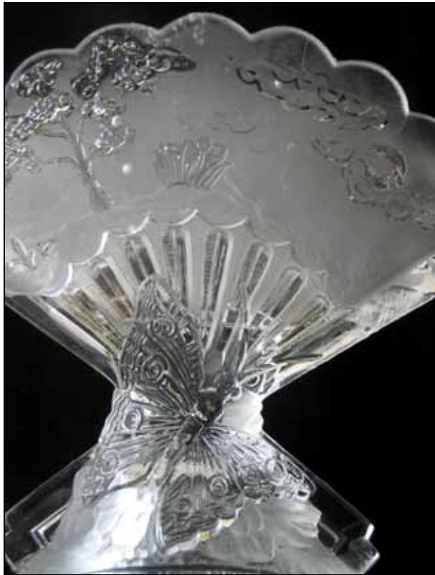
Abb. 2010-3/095 Vase mit Schmetterlingen farbloses, teilweise mattiertes Pressglas, H 13,5 cm, B 15,2 cm, T 5,4 cm Sammlung Vogt im Innern eingepresste Marke „BACCARAT“ vgl. MB Baccarat 1870, Planche 308, Vasen No. 5376 und No. 5377