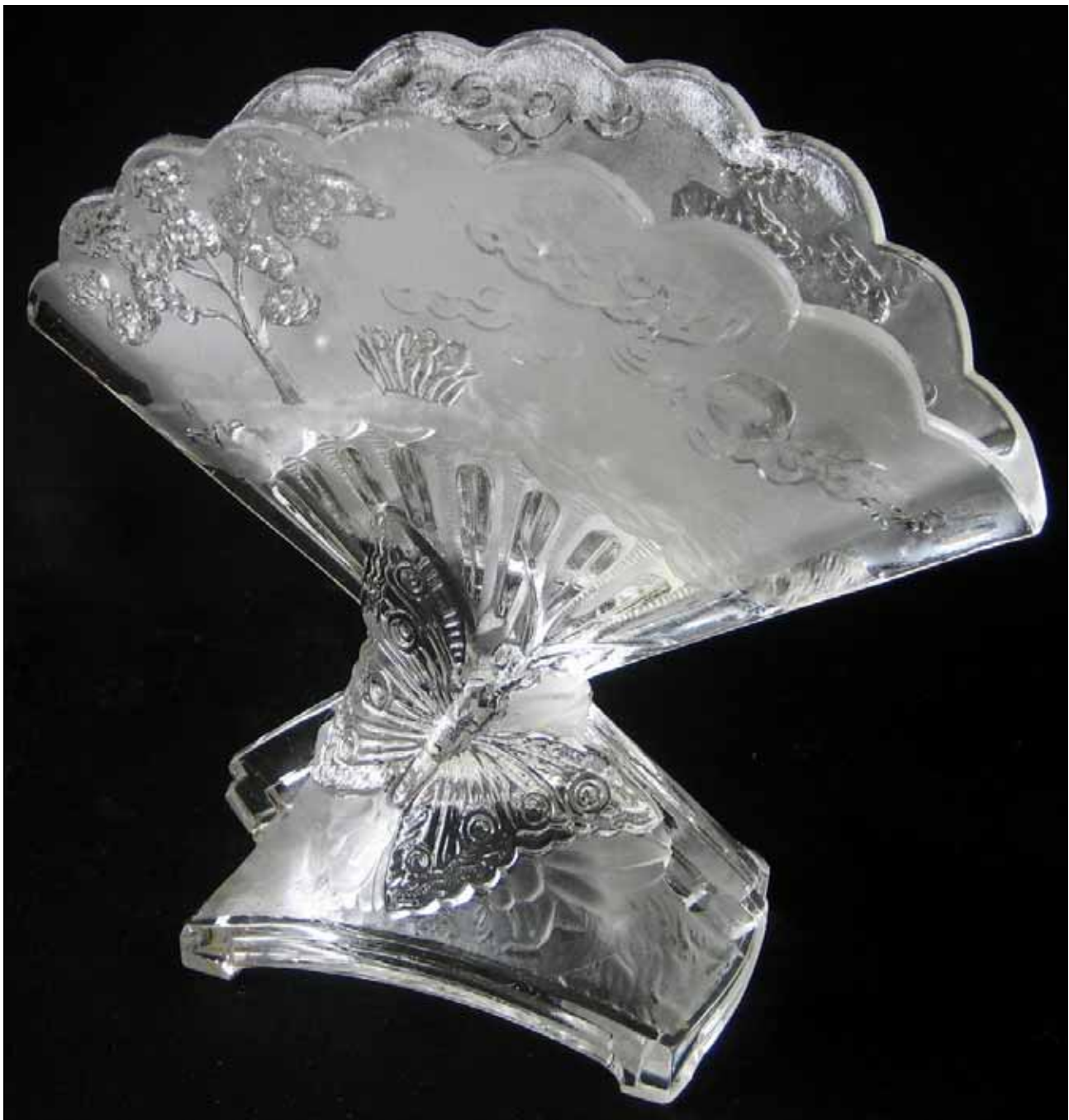
Abb. 2010-3/094 (Maßstab ca. 110 %) Vase mit Schmetterlingen, farbloses, teilweise mattiertes Pressglas, H 13,5 cm, B 15,2 cm, T 5,4 cm Sammlung Vogt im Innern eingepresste Marke „BACCARAT“, vgl. MB Baccarat 1870, Planche 308, Vasen No. 5376 und No. 5377