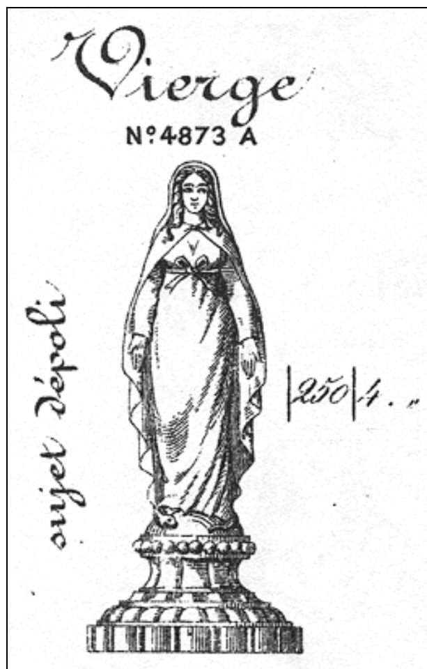
Abb. 2010-3/001 Figur der Madonna mit ausgestreckten Armen auf einer Weltkugel zertritt sie eine Schlange farbloses, gepresstes Bleikristallglas, teilweise mattiert H 25,3 cm, D Sockel 11,1 cm, G 1.090 g Sammlung Vogt s. MB Baccarat 1893, Planche 50, Moulure, Objets de Sainteté No. 4873 A, Vierge, 250 mm

Abb. 2001-04/350 MB Baccarat 1893, Planche 50, Objets de Sainteté (Suite) No. 4873 A, Vierge, s.a. Planche 48, No. 4872 A, Vierge Reprint Edition Collections Livres Brüssel 2000