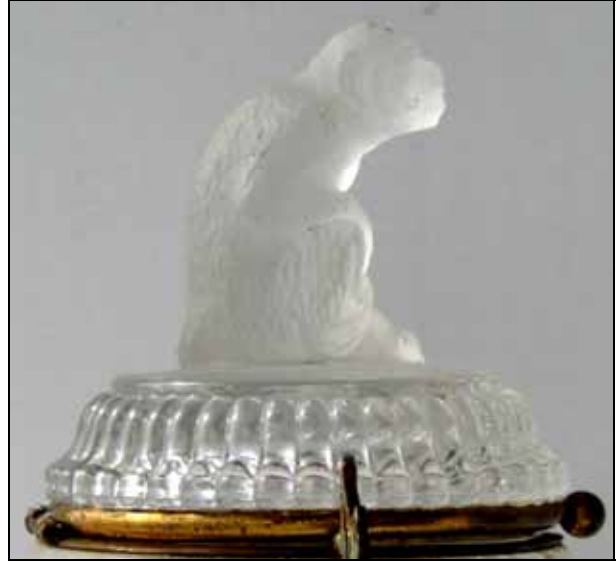
Abb. 2005-1/104 MB Baccarat, um 1880?, 2° Partie, Planche 272, Articles divers, No. 4913, Pot à Tabac MB Sammlung Fehr