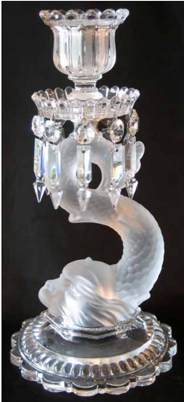
Abb. 2001-04/366 → MB Baccarat 1893, Planche 81, Candelabres (Suite) Reprint Edition Collections Livres Brüssel 2000