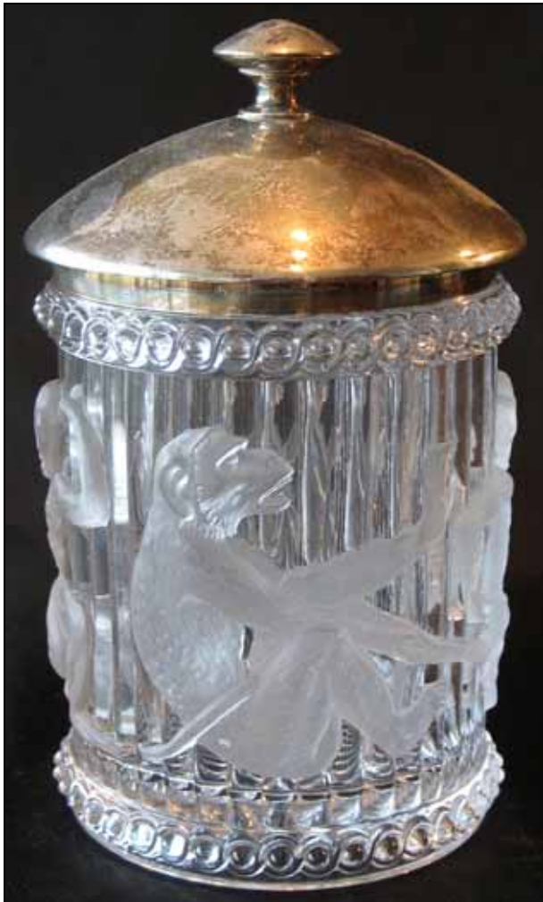
Vogt: Zu dem Tabaktopf gehört normalerweise ein Glasdeckel mit einem Affen. Der wird abhanden gekommen sein und man hat deshalb einen 98 g schweren Deckel aus Sterlingsilber anfertigen lassen. Der Deckel ist gemarkt mit: Halbmond, Krone, 925, Gebr. Sommé Nachf. und wurde vermutlich in Breslau hergestellt.