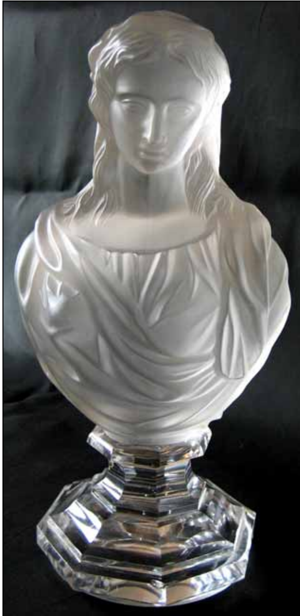
Abb. 2010-3/006 Büste der Madonna farbloses, gepresstes Bleikristallglas, teilweise mattiert H 26,5 cm, B 13,7 cm, T 8 cm, G 3.175 g Sammlung Vogt auf der Rückseite eingepresste Marke „BACCARAT DÉPOSÉ“ s. MB Baccarat 1893, Planche 49, No. 4871 A, Buste Vierge, 270 mm