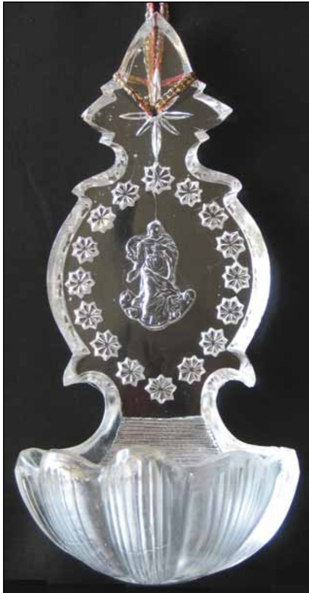
Abb. 2010-3/018 Weihwasserbecken mit Christus auf Wolke und Sternen farbl., opalisierendes Pressglas, H 16,5 cm, B 8 cm, T 5 cm Abriss abgeschliffen Sammlung Vogt, PV-1110 s. MB St. Louis 1872, Planche 4, No. 7