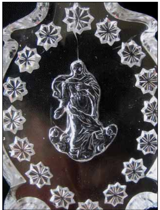
← Abb. 2005-3-15/005 MB Saint Louis, um 1872, 1 re Partie, Planche 4, Moulure Assiettes à dessert (suite), No. 1 - 8, Benitiers No. 1 - 7 No. 7 Benitier christ moule étoiles 175 mm