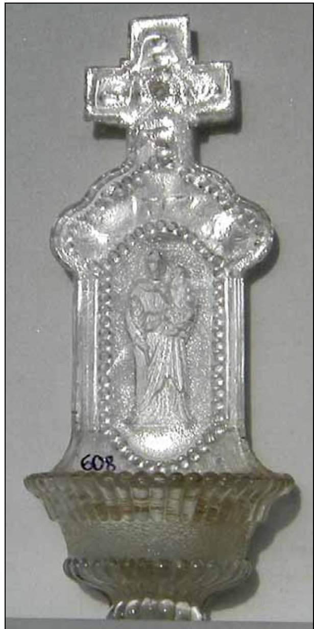
Abb. 2002-1/186 Weihwasserbecken „Heiliger mit Jesus auf dem Arm & Palme“ negatives Relief auf der Rückseite mit Gips ausgestrichen unten am Becken Ansatz des Hefteisens, abgeschliffen und poliert farbloses Glas, H 18,1 cm, B 7,7 cm, T ??? cm ehem. Sammlg. Geiselberger PG-608, ehem. Sammlung Lenek Marke „SV“ auf der Rückseite nicht mehr nachprüfbar PK 2002-1, SG: Hersteller unbekannt, Böhmen?, um 1900? PK 2010-3, SG: Hl. Josef von Nazareth mit Jesuskind, weiße Lilie in der rechten Hand als Symbol der Keuschheit wohl Schmid Verreries, Vannes-le-Châtel / Allamps, ~ 1875