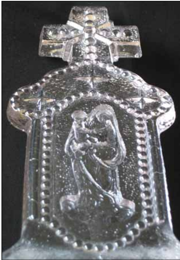
Abb. 2010-3/023 Weihwasserbecken mit Madonna und Jesuskind 3 Sterne, Perlen farbl., opalisierendes Pressglas, H 17,7 cm, B 7,6 cm, T 5 cm Sammlung Vogt, PV-1111 auf der Rückseite eingepresste Marke „SV“ „SV“ - Schmid Yverries“, Vannes-le-Châtel / Allamps, Frankreich, um 1875