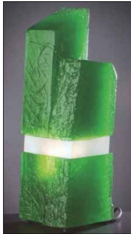
Abb. 2010-4/226 Modellieren von Pressglas, Entwurf Lucie Táborská, Zweiteilige Vase, hütten-geblasenes Glas, 2003, H 34 und 36 cm, http://www.supss.cz/en/modelling-pressed-glass.php (Ausschnitt) (2010-10)

Die Abteilung Modellieren von Pressglas ist hauptsächlich industriellem Design gewidmet. Die Ausbildung ist auf die Kunst der Gravier-Techniken von Metall spezialisiert und die Formen-Produktion für nicht manuelle Verarbeitung. Studenten erarbeiten gleichzeitig Design für geschmolzenes Glas . Absolventen haben nicht nur in der Glasindustrie, sondern auch außerhalb große Möglichkeiten.