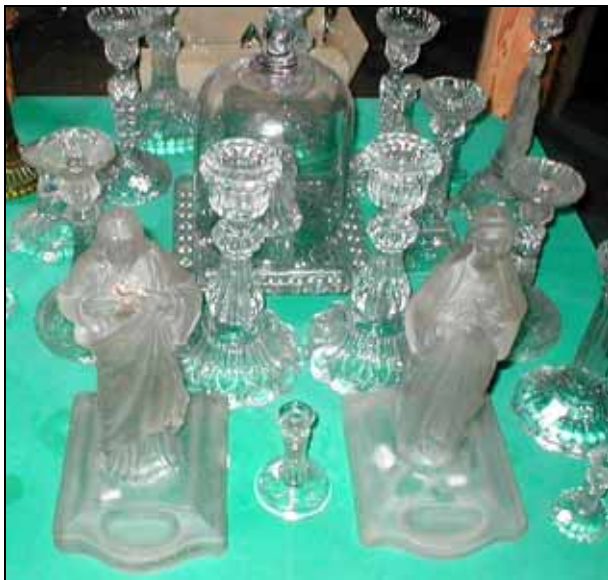
Abb. 2003-3/308 Glasmuseum Meisenthal Juli 2003, Ausstellungsvitrinen Christus und Madonna als Kerzenleuchter, Frankreich, vor 1900

PK 2004-4, SG: Die Pressgläser im Lager des Glas-museums Meisenthal sind nicht alle in Meisenthal hergestellt worden. Es ist eine zufällige Ansammlung von Meisenthal, Portieux und Vallérystal , vielleicht auch von anderen Glaswerken. Ob also die Figuren Christus und Madonna im Vordergrund aus Meisenthal kommen, ist unklar, aber auch nicht unmöglich.