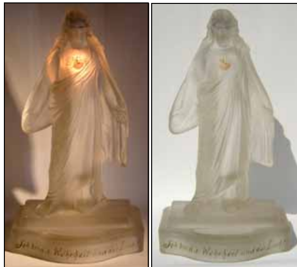
Abb. 2004-4/263 Figur Christus mit ausgebreiteten Händen und strahlendem Herzen mit Kreuz, rückseitig niedriger glatter Sockel mit Kerzenloch, vorne Weihwassermulde farbloses, mattiertes Glas, H 26,2 cm, B 14,1 cm, T 13,2 cm ehem. Sammlung Geiselberger PG-387 am Sockel oben eingepresste Inschriften „ROMA“, „Ges. Geschützt“ und „176028 S“ vorne gemalte Inschrift „Ich bin die Wahrheit und das Licht.“ Hersteller unbekannt, Deutschland, Böhmen / Mähren, um 1900

1883 wurde die Pariser Verbandsübereinkunft zum Schutz des gewerblichen Eigentums geschlossen, 1886 folgte die Berner Übereinkunft zum Schutz von Werken der Literatur und Kunst. Das Madrider Abkommen über die internationale Registrierung von Marken von 1891 war ein Abkommen zwischen vielen Ländern, durch welche nationale Marken eines Verbandsstaates auch in den anderen Verbandsstaaten Schutz genießen konnten und somit eine international registrierte Marke geschaffen werden konnte. Das Abkommen wurde in den Jahren 1900, 1911, 1925, 1934, 1957 und 1967 in Stockholm revidiert. Das bedeutet nicht, dass es in den Vertragsstaaten einheitliche Gesetze und Bezeichnungen gegeben hat.