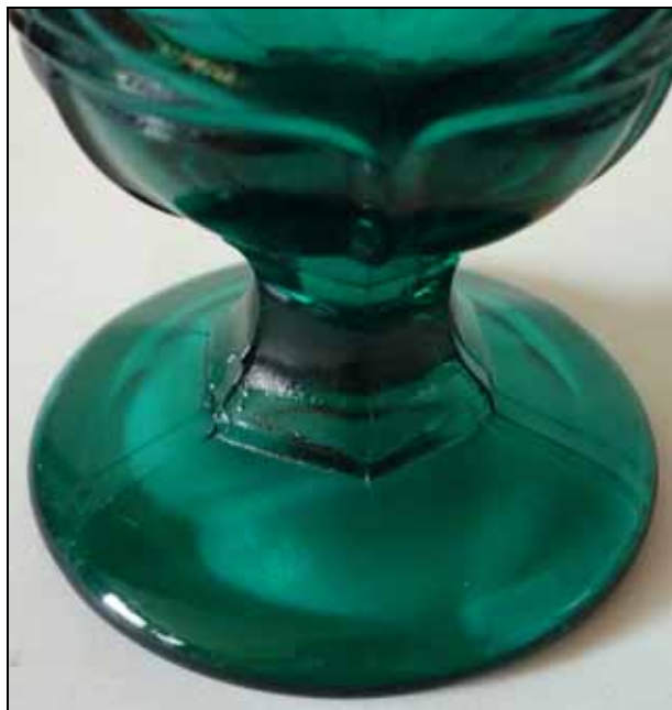
Abb. 2011-2/080 Fußbecher mit Rauten und Bockskopf grünes Pressglas, H xxx cm, D xxx cm Sammlung Schulschenk Vorbild Cristallerie de St. Louis, um 1870 wohl IVIMA, Portugal, Ende 20. Jhdt. s. MB IVIMA Marinha Grande 1901, S. 78, Nr. 98

Mit freundlichen Grüßen, Siegmund Geiselberger