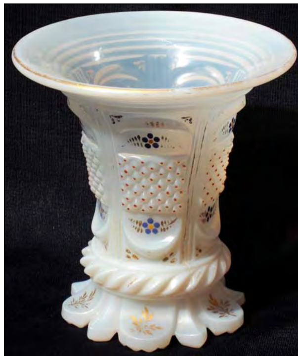
Abb. 2001-1/171 neu

Jasmin-Vase „m. à diamants et feuilles“ opaline-farbenes Glas mit bunter Kaltbemalung H 13 cm, D oben 12 cm Sammlung Zeh