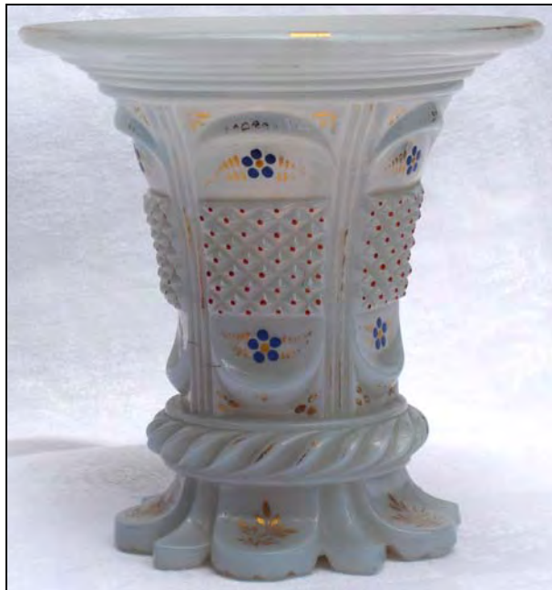
Abb. 2001-5/354 (Ausschnitt)

Jasmin-Vase „m. à diamants et feuilles“ opaline-farbenes Glas mit bunter Kaltbemalung H 13 cm, D oben 12 cm Sammlung Zeh s. MB Launay, Hautin & Cie., um 1840, Planche 28 No. 1423, Vases à Jasmins, Vase „m. à diamants et feuilles“ Baccarat und St. Louis, um 1840 nicht mehr in MB Launay, Hautin & Cie. um 1841!