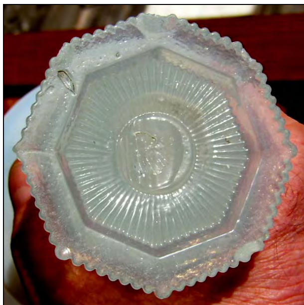
Abb. 2008-3/091 Jasmin-Vase mit Spitzbögen und Diamanten-Band, Grund Sablée, 8-eckiger Fuß, über dem Fuß spiralig verdrehtes Band auf dem Boden runde Scheibe mit roh belassenem Abriss opalisierendes, opak-weißes, form-geblasenes Glas H 16,7 cm, D Rand 13,4 cm, D Fuß 9 / 9,5 cm Sammlung Geiselberger PG-1123

PK 2008-3: Hersteller unbekannt, Frankreich, Belgien, um 1850-1870?