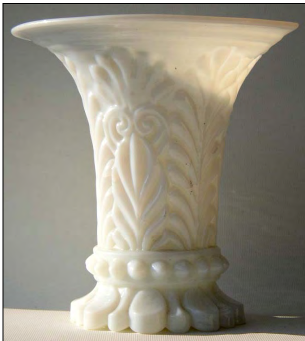
Abb. 2005-4/017 Jasmin-Vase mit Palmetten und Blättern form-geblasenes opak-weißes Glas, H 14,4 cm, D 14,5 cm auf dem Boden runde Scheibe mit ausgekugelterm Abriss Sammlung Geiselberger PG-957 PK 2005-4: Hersteller unbekannt, Frankreich, um 1840 PK 2008-3: Hersteller unbekannt, Frankreich, Belgien, um 1830

Farbe, Bemalung und Qualität der Jasmin-Vase Sammlung Zeh sind im Vergleich mit den anderen Jasmin-Vasen außergewöhnlich. Diese zeitlich genau von 1830 bis 1840 datierbare Vase ist der Maßstab für die Zuordnung anderer Vasen. Wegen der deutlich schlechteren Qualität müssen alle viel früher datiert werden: um 1830. Einzige Ausnahme ist die Vase Kaiser Napoléon III., frühestens um 1852, spätestens um 1870.