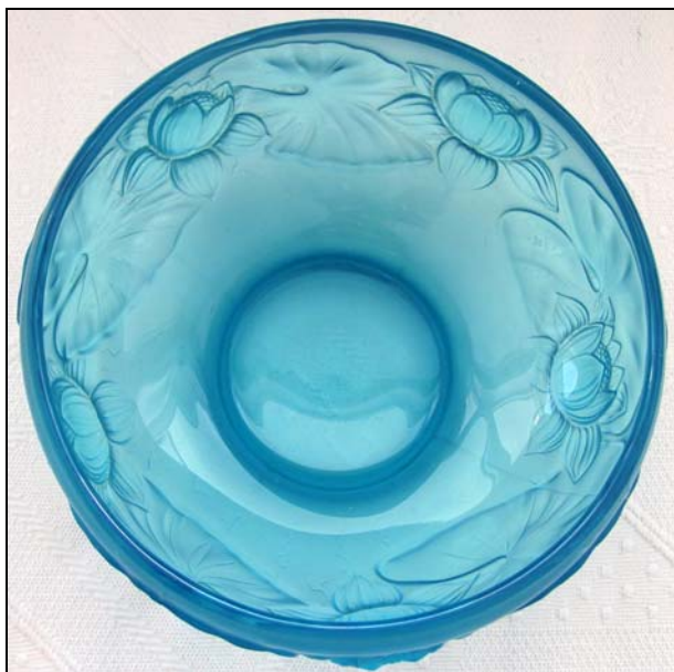
Abb. 2012-1/35-02 Schale mit Seerosen hellblaues Pressglas, fein mattiert, H 12,5 cm, D 22 cm Sammlung Kuban ohne Marke, s. MB Glassexport „Barolac“ 1949/1952, Tafel B 2, Nr. 11281/A 9 ¼“, B 8 ½“, C 11“ [Zoll] [D 23,5 cm] s.a. MB Markhbeinn 1935, Tafel 28, Vases, Nr. 11381