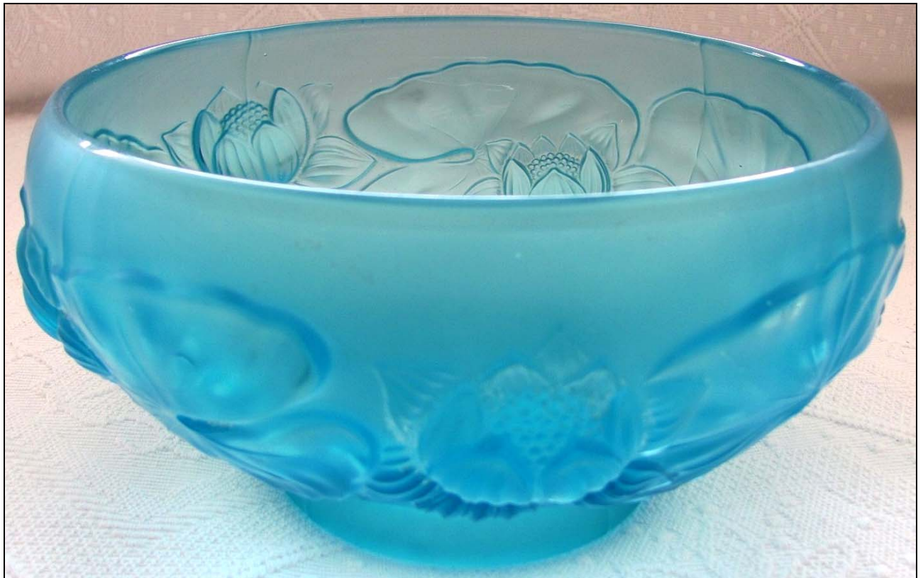
Abb. 2012-1/35-01 Schale mit Seerosen, hellblaues Pressglas, fein mattiert, H 12,5 cm, D 22 cm Sammlung Kuban, s.a. Sammlung Stopfer PK Abb. 2006-1/322, H 12,5 cm, D 24 cm ohne Marke, s. MB Glassexport „Barolac“ 1949/1952, Tafel B 2, Nr. 11281/A 9 ¼“, B 8 ½“, C 11“ [Zoll] [D 23,5 cm] s.a. MB Markhbeinn 1935, Tafel 28, Vases - coupes dessins en relief mate moderne - Bohême, Nr. 11381, D 22 cm ...