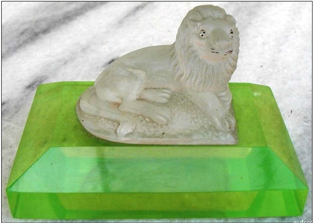
Abb. 2012-1/39-01 (Maßstab ca. 150 %) Liegender Löwe auf einem Sockel, farbloses Pressglas, mattiert, Reste von Bemalung, H 6,5 cm, Sockel 11 x 7 cm Sockel gelbes Glas, geschliffen, poliert Sammlung Kuban Hersteller unbekannt, Böhmen, vor 1900, wohl nicht Riedel, Unterpolaun