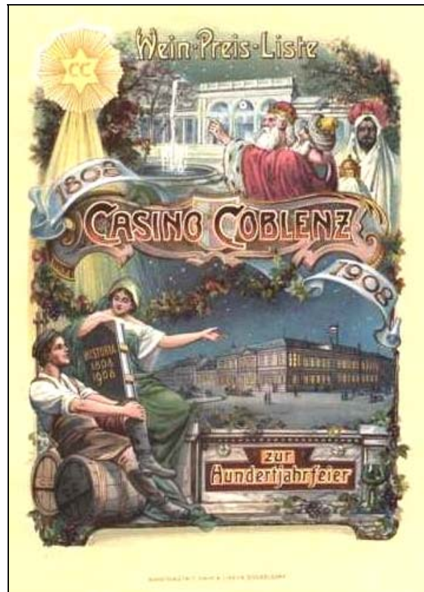
Abb. 2012-2/10-002 Casino Coblenz Wein-Preis--Liste 1808-1908 Zur Hunderjtahrfeier 1808-1908

[ www.casino-coblenz.de/casino-coblenz/ueber-uns/ ]