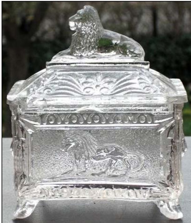
Abb. 2012-2/56-01 Dose mit Löwen farbloses Pressglas, H 12 cm, L 11 cm Hersteller unbekannt, Frankreich, um 1900

SG: Beide Dosen waren schon mal in der PK, die Dose mit dem Löwen finde ich aber nicht mehr. Ich bin ziemlich sicher, dass sie auch damals nicht zugeschrieben werden konnte.