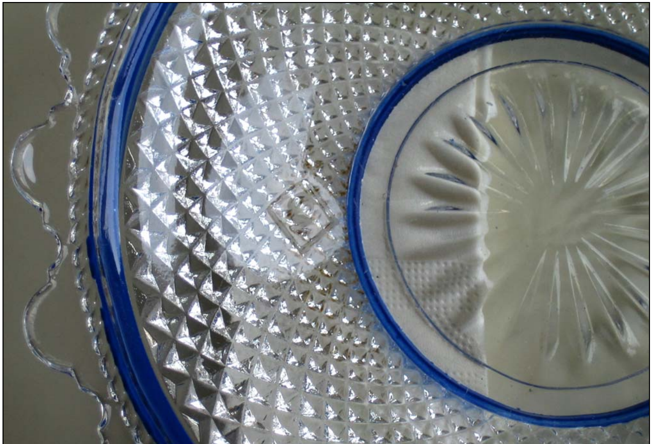
Abb. 2012-2/21-01 Schale mit Spiralen aus Diamanten, Rand mit gekerbten Bögen und Schnur, farbloses Pressglas, H 2,7 cm, D 21,5 cm Sammlung Jeschke eingepresste Marke „SN in einer Raute“ und aufgemalte Initialen „K in O“ Josef Schreiber & Neffen AG, um 1900