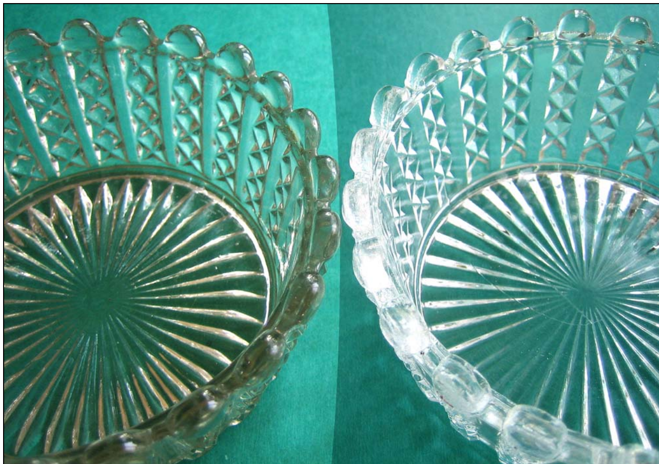
Abb. 2012-2/33-01 Zwei Schalen mit Rippen und Diamanten, farbloses Pressglas, H 5,5 cm, D 13 cm Sammlung Jeschke

dunklere Schale mit eingepresster Marke in gleichschenkeligem Dreieck „St.S.“, helle Schale ohne Marke Carl Stölzle's Söhne, wahrscheinlich Glashütte Georgenthal [Jiřikovo Údolı], bei Gratzen [Hové Hradı], um 1880? - 1911