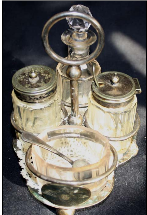
Abb. 2012-2/48-03 Menage in (ver?)silbertem Ständer farbloses Kristallglas, Sammlung Rühl & Sadler Ständer gemarkt mit „ James Dixon & Sons, Sheffield “, Wappen , „ Hard Soldered “ und „ K926 “

Ich denke zwar das es sich hier nicht um Pressglas, sonder eher um Kristallglas handelt, aber vielleicht ist es für die PK ja doch interessant.