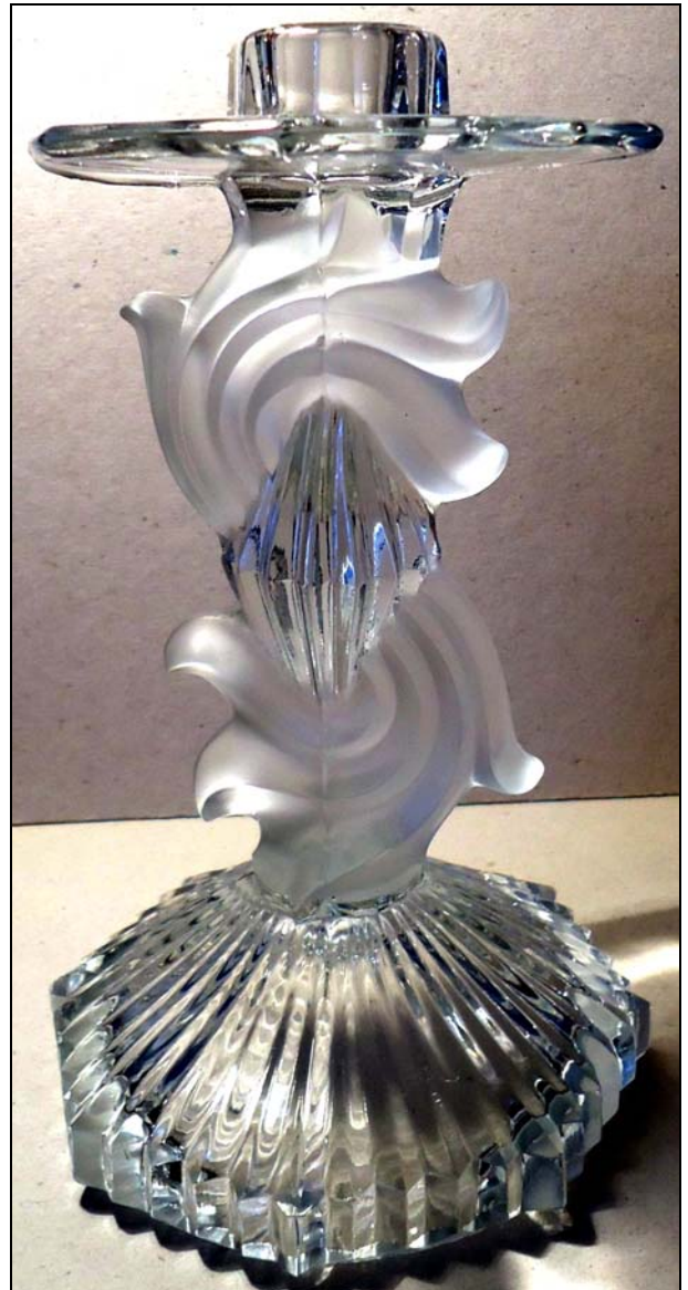
Abb. 2010-1-06/004 (Ausschnitt)

MB Libochovice 1930-1939, Fotografien, Tafel o.Nr., Leuchter Nr. 1224