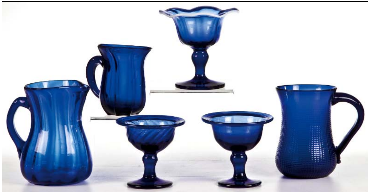
Abb. 2012-3/19-02 Los Nr. 61 - Drei Henkelkrüge und drei Fußschalen aus kobaltblauem Glas, Abrissgläser Fünf Teile mit optischem Dekor, ein Teil glatt. Zwei Schalen mit umgeschlagenem Rand, eine Schale mit Weißrand. H. 9-13,5 cm Deutsch, E. 18./19. Jhdt., Katalogpreis: 50 - 70 €, Zuschlag: 210,00 €