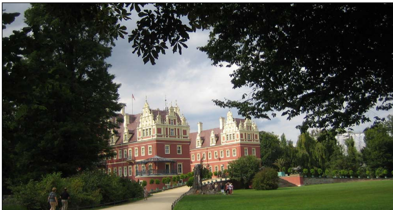
Abb. 2012-3/36-01 Neues Schloss Bad Muskau, Foto Mauerhoff 2012-08