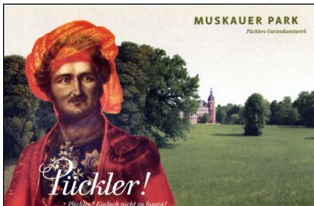
Abb. 2012-3/36-02 Muskauer Park - Pücklers Gartenkunstwerk, im Schloss Ausstellung „Pückler? Einfach nicht zu fassen“

Fürst Pückler ist vielen namentlich bekannt, vielleicht besonders durch ein Speiseeis mit seinem Namen. Weltum erlangte aber Hermann Fürst von Pückler-Muskau durch eine wunderbare Parklandschaft , die sich beid-