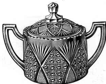
Zuckerdose, mit Deckel