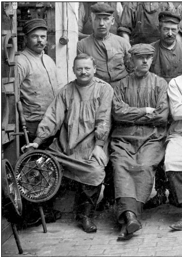
Abb. 2002-5-2/017 Glasfabrik AG Brockwitz, Schlosserei 1910, Ausschnitt in dieser Schlosserei wurden auch Pressformen hergestellt Pressform vom Service „Imperat“, No. 15214 ... s. MB Brockwitz 1915, Tafel 61-63a

Schildeinsatz ” - with oval free place for pasting photos or painting pictures . A copy of the mould for the vase was made with an oval free place for inserting different oval moulds - either as blank place for painting or for pressing names of breweries in beer mugs -steins etc. This was not made by Brockwitz itself but by local sellers and painters or photographs - mostly used were clips of post cards - have a look at dishes of Davidson or Streit with pasted postcards : www.pressglas-korrespondenz.de/aktuelles/pdf/pk-2004-4w-stopfer-schalen-fotografien.pdf