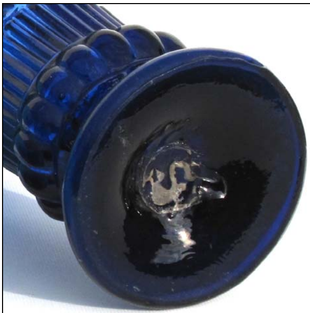
Abb. 2012-4/22-02 & Abb. 2012-4/22-02 Jasminvase mit Blättern, Blüten und Beeren, press-geblasen opak-blaues Glas, H 16,8 cm, D 10,9 cm, G 464 g Sammlung SG 2012-11 Hersteller unbekannt, Frankreich, um 1870-1890 s. http://opaline.defoire.pagesperso-orange.fr . No. 5.76 Vase «Trèfles gothiques», St. Louis, um 1870-1890