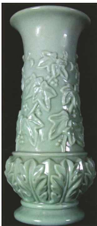
Abb. 2012-4/22-03 Jasminvase mit Blättern, Blüten und Beeren, press-geblasen opak-blaues Glas, H 16,8 cm, D 10,9 cm, G 464 g Sammlung SG 2012-11 Hersteller unbekannt, Frankreich, um 1870-1890 s. http://opaline.defoire.pagesperso-orange.fr . No. 5.76 Vase «Trèfles gothiques», St. Louis, um 1870-1890

S. 119, No. 385 / 5.68 «Lierre» [Efeu], Saint-Louis , référence Fe 807 du catalogue de 1870 . Décoration de feuilles d' acanthé pour la partie inférieure et de feuilles et baies de lierre pour le reste. Connue en vert , présent dans les catalogues suivants . Proposé en trois tailles: 200 , 250 et 300 mm. Hauteur 30 cm.