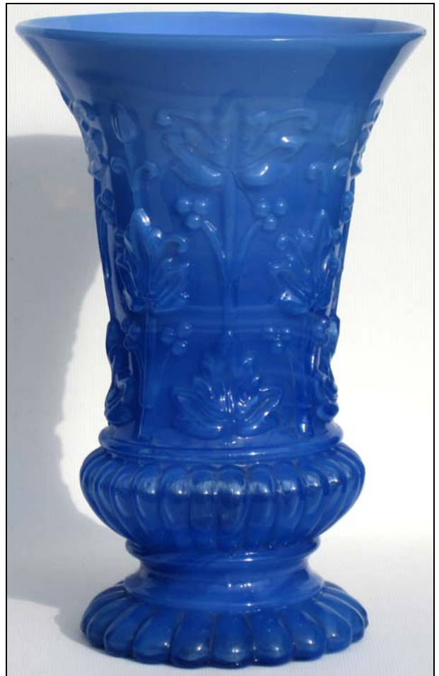
Abb. 2012-4/22-05 Jasminvase mit Blättern, Blüten und Beeren, opak-weißes, press-geblasenes Glas, H 18,3 cm, D 11,4 cm, G 509 g opak-weißes Glas, H 18,4 cm, D 10,9 cm, G 497 g, opak-blaues Glas, H 16,8 cm, D 10,9 cm, G 464 g Sammlung SG 2 x 1088, 2012-11 Hersteller unbekannt, Frankreich, um 1870-1890 s. http://opaline.defoire.pagesperso-orange.fr . No. 5.76 Vase «Trèfles gothiques», St. Louis, um 1870-1890