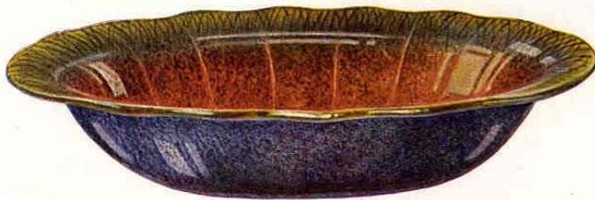
Nr. 6003 32x22,3 cm

Fruchtkorb, oval, mit Dekor - Coupe, oval, décoré Fruit-bowl, oval, with decoration Fuente para frutas, ovalada, con decoración 250.— Gewicht - Poids - Weight - Peso 850 g Packung - Emballage - Packing - Embalaje 180 St. - Pcs. - Pzs. Br. 240 kg, Net. 150 kg = 0,90 cbm