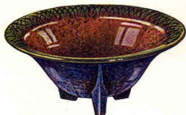
Nr. 6084 ø 16 cm