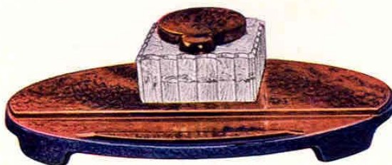
Nr. 6121 ø 16x25 cm

Dose - Boîte - Box - Caja Gewicht - Poids - Weight - Peso 450 g 200.— Packung - Emballage - Packing - Embalaje 240 St. - Pcs. - Pzs. Br. 195 kg, Net. 110 kg = 0,90 cbm