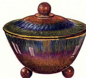
Nr. 6001 ø 14 cm

Schale - Coupe - Bowl - Fuente Gewicht - Poids - Weight - Peso 400 g 145.— Packung - Emballage - Packing - Embalaje 384 St. - Pcs. - Pzs. Br. 200 kg, Net. 150 kg = 0,70 cbm