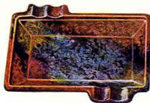
Nr. 6045 ø 12x8 cm

Gewicht - Poids - Weight - Peso 1420 g 290.— Packung - Emballage - Packing - Embalaje 72 St. - Pcs. - Pzs. Br. 220 kg, Net. 120 kg = 0,70 cbm