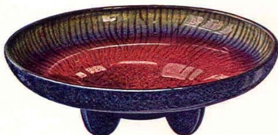
Nr. 6010 ø 24 cm