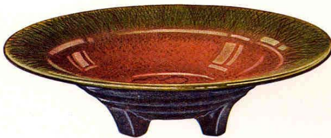
Nr. 6065 ø 30 cm

Schale auf 4 Füßen mit Dekor - Coupe sur 4 pieds décoré Bowl with 4 feet with decoration Fuente con 4 pies con decoración 320.— Gewicht - Poids - Weight - Peso 1200 g Packung - Emballage - Packing - Embalaje 72 St. - Pcs. - Pzs. Br. 200 kg, Net. 110 kg = 0,79 cbm