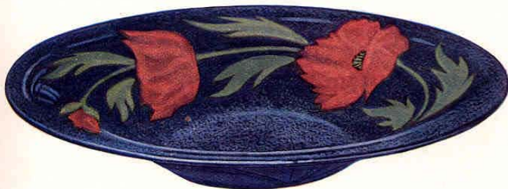
Nr. 7006 ø 33,5 cm