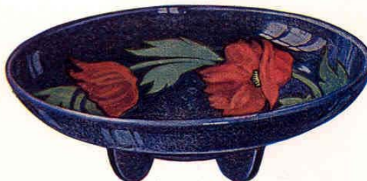
Nr. 7010 ø 24 cm

Schale - Coupe - Bowl - Fuente Gewicht - Poids - Weight - Peso 600 g 200.— Packung - Emballage - Packing - Embalaje 240 St. - Pcs. - Pzs. Br. 245 kg, Net. 145 kg = 1,10 cbm