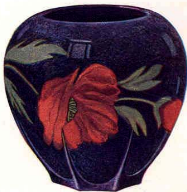
Nr. 7039 ø 15 cm

Konfektschale - Coupe - Sweet-dish - Bombonera 180.— Gewicht - Poids - Weight - Peso 500 g Packung - Emballage - Packing - Embalaje 240 St. - Pcs. - Pzs. Br. 220 kg, Net. 120 kg = 1,10 cbm