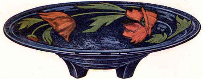
Nr. 7065 ø 30 cm