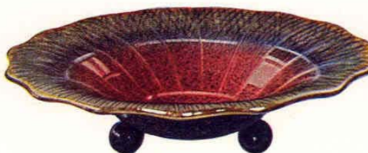
Nr. 6004 ø 23 cm

Schale mit Dekor - Coupe décoré - Bowl with decoration - Fuente con decoración 225.— Gewicht - Poids - Weight - Peso 600 g Packung - Emballage - Packing - Embalaje 240 St. - Pcs. - Pzs. Br. 245 kg, Net. 145 kg = 1,10 cbm