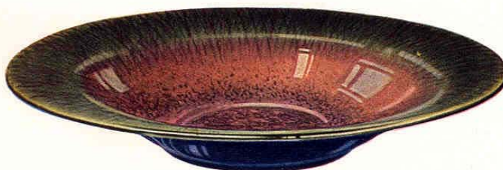
Nr. 6006 ø 33,5 cm