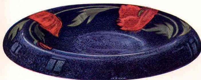
Nr. 7016 ø 31 cm