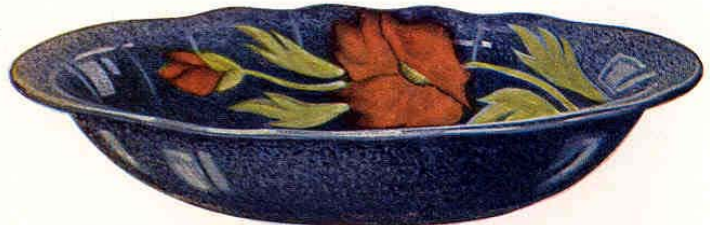
Nr. 7003 ø 32x22,3 cm

Schale auf 4 Füßen - Coupe sur 4 pieds - Bowl with 4 feet Fuente con 4 pies 295.— Gewicht - Poids - Weight - Peso 1200 g Packung - Emballage - Packing - Embalaje 72 St. - Pcs. - Pzs. Br. 200 kg, Net. 110 kg = 0,79 cbm