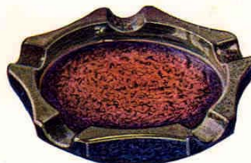
Nr. 6110 ø 16 cm

Ascher - Cendrier - Ash-tray - Cenicero Gewicht - Poids - Weight - Peso 150 g 70.— Packung - Emballage - Packing - Embalaje 840 St. - Pcs. - Pzs. Br. 200 kg, Net. 130 kg = 0,79 cbm