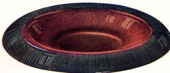
Nr. 6016 ø 31 cm