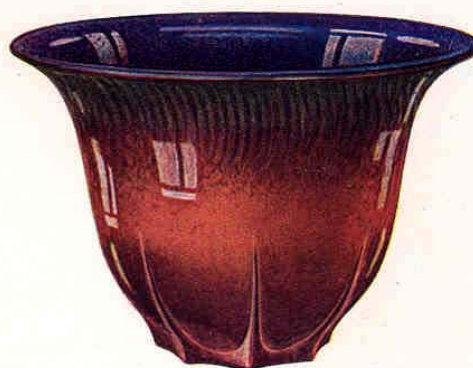
Nr. 6037 ø 19 cm

Vase, eingez., mit Dekor - Vase au bord rentrant décoré Vase turned in with decoration Florero encorvado con decoración 250.— Gewicht - Poids - Weight - Peso 1170 g Packung - Emballage - Packing - Embalaje 96 St. - Pcs. - Pzs. Br. 180 kg, Net. 110 kg = 0,70 cbm