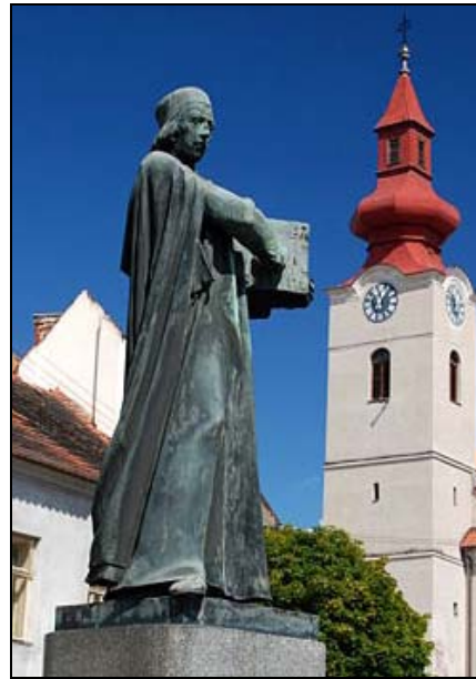
Abb. 2013-1/40-08 Denkmal „Jan Hus“, Louny, errichtet 1925 Entwurf Josef Kvasnička aus http://pozvete-nas-dal.webnode.cz/socha-jana-husa/