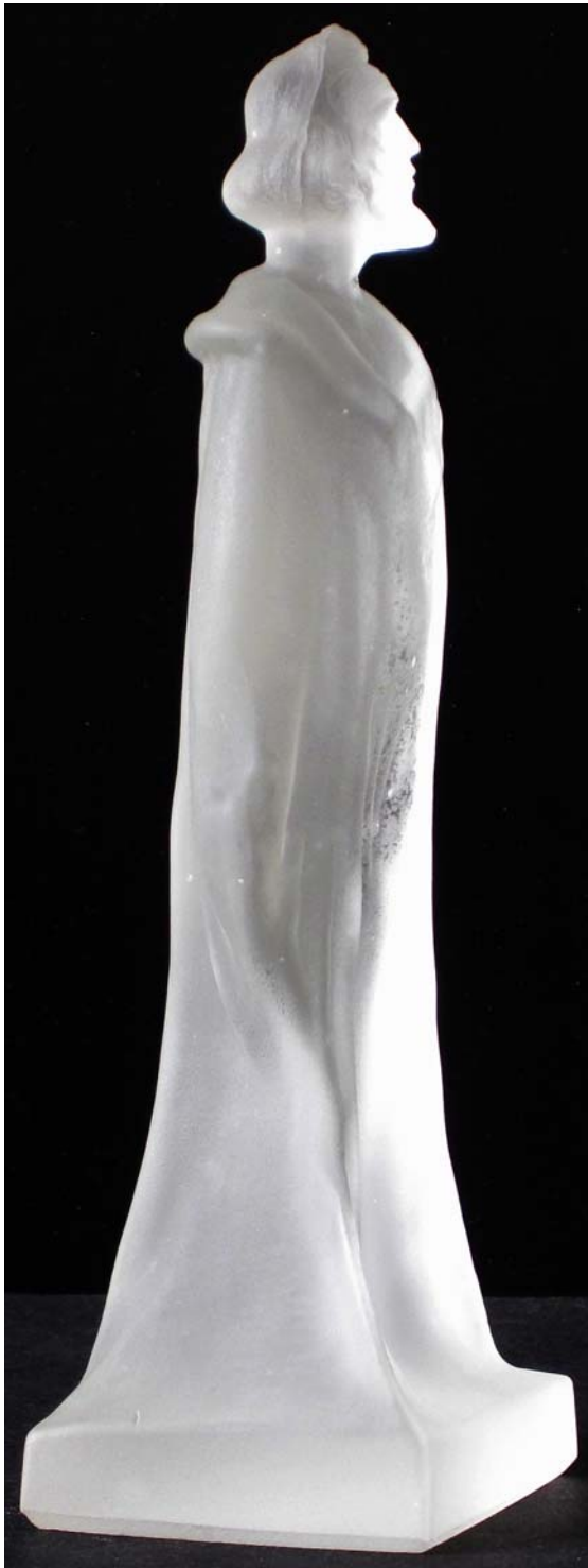
Abb. 2013-1/40-03 (Maßstab ca. 115 %) Kleine Figur „Jan Hus“ farbloses Pressglas, mattiert, H 16,6 cm, B 5,1 x 4,7cm Sammlung Maierholzner Hersteller unbekannt, Tschechoslowakei, nach 1918

Seit Jahren war also klar, dass es von Jan Hus auch Andenken aus Pressglas geben musste. Erst jetzt hat Herr Maierholzner tatsächlich auf dem Flohmarkt in Buštěhrad bei Pilsen eine kleine Figur von Jan Hus