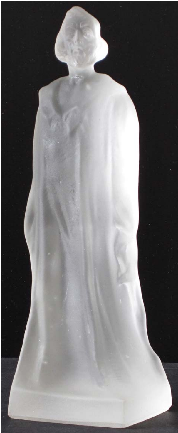
Abb. 2013-1/40-01 (Maßstab ca. 115 %) Kleine Figur „Jan Hus“ farbloses Pressglas, mattiert, H 16,6 cm, B 5,1 x 4,7cm Sammlung Maierholzner Hersteller unbekannt, Tschechoslowakei, nach 1918