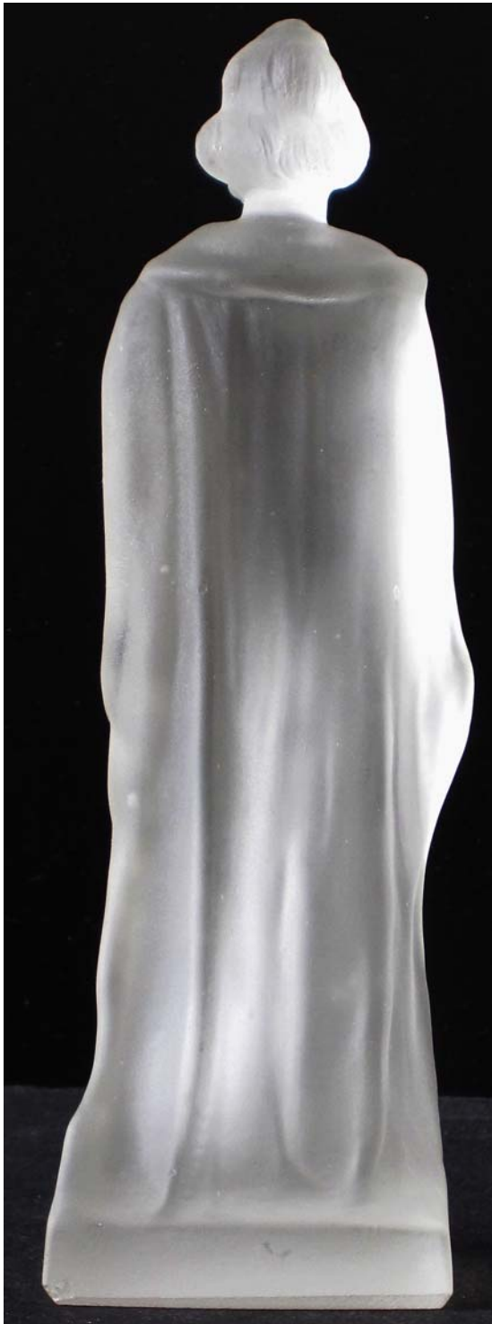
Abb. 2013-1/40-05 (Maßstab ca. 115 %) Kleine Figur „Jan Hus“ farbloses Pressglas, mattiert, H 16,6 cm, B 5,1 x 4,7cm Sammlung Maierholzner Hersteller unbekannt, Tschechoslowakei, nach 1918

Abb. 2013-1/40-04b → Denkmal „Jan Hus“, Altstädter Ring, Prag, errichtet 1915 Entwurf Ladislav Šaloun aus GOOGLE Bilder Hus