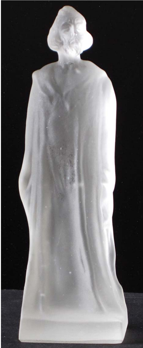
Abb. 2013-1/40-02 (Maßstab ca. 115 %) Kleine Figur „Jan Hus“ farbloses Pressglas, mattiert, H 16,6 cm, B 5,1 x 4,7cm Sammlung Maierholzner Hersteller unbekannt, Tschechoslowakei, nach 1918

Später lernte ich, dass die Umgebung von Krásno ein Gebiet war, in dem die anti-katholisch gesonnenen Walachen auch noch lange nach dem Dreißigjährigen Krieg gegen die Rekatholisierung gekämpft haben und blutig niedergeworfen wurden. Die Walachen waren