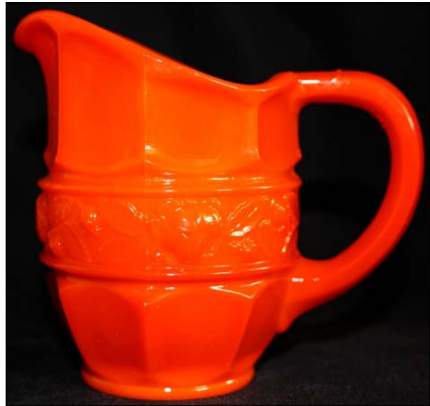
Abb. 2013-1/35-03 Sahnekännchen mit Rosen-Fries opak-oranges Pressglas, H 10,2 cm, D oben 7,4 cm, D B. 5 cm Brockwitz AG, 1929-1931, s. MB Brockwitz Nachtrag 1929, Tafel 19, Service „Ariadne“, Sahnesatz Nr. 41035a, Sahnegießer Nr. 41030a