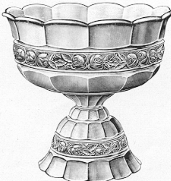
Fruchtschale, 2 teilig