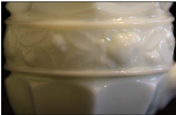
Abb. 2000-2/322 (Ausschnitt) Nachtrag Brockwitz 1929, Tafel 19, Service „Ariadne“ MB Sammlung Neumann