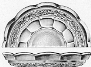
Zucker- und Dessertteller