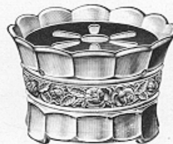
Teewärmer, mit Metallplatte und Einsatz