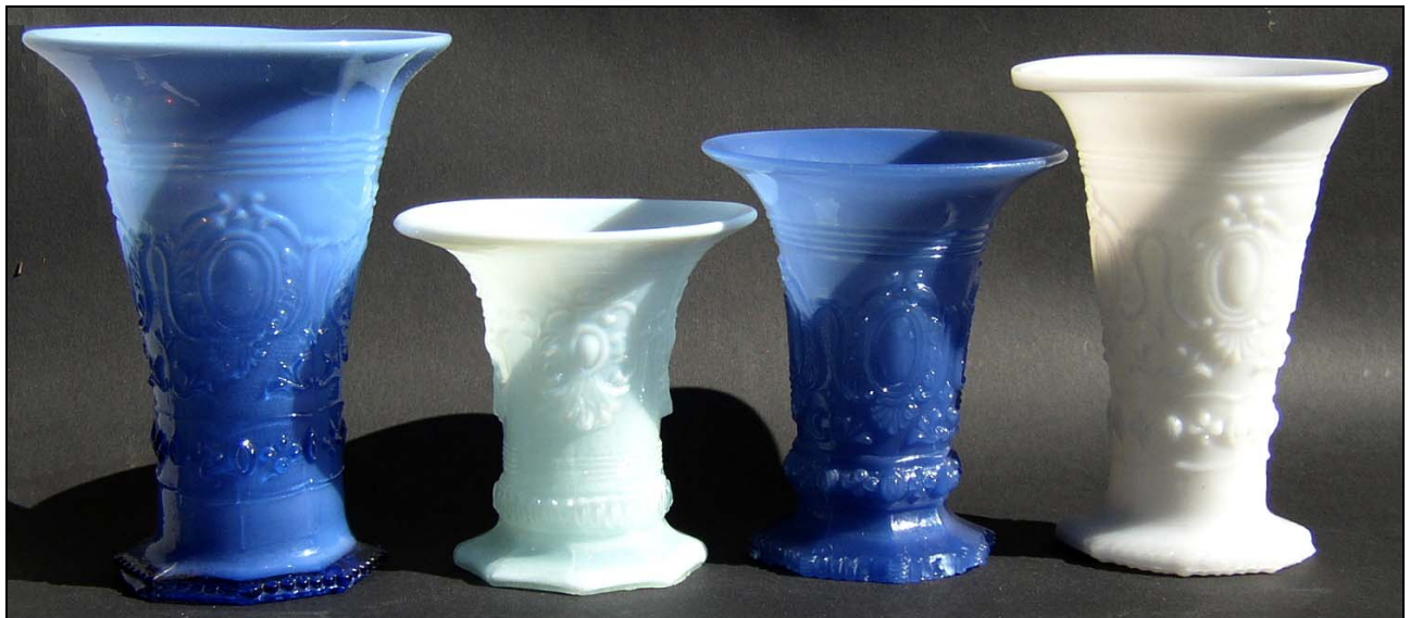
Abb. 2013-1/09-01 (oben rechts!)

Jasmin-Vase mit Ovalen, Ranken und Blüten, Grund Sablée, Muster und Sablée verschwommen, Fuß 8-eckig opak-blaues - dunkelblaues, form-geblasenes Glas, H 15,7 cm, D Rand 12 cm, D Boden diag. 8,4 / 8 cm Boden & Abriss roh belassen, Fuß wackelt, Oberfläche „matt glänzend“, nicht glänzend wie PG-877, Wand & Formnähte leicht verdreht Sammlung SG 2013