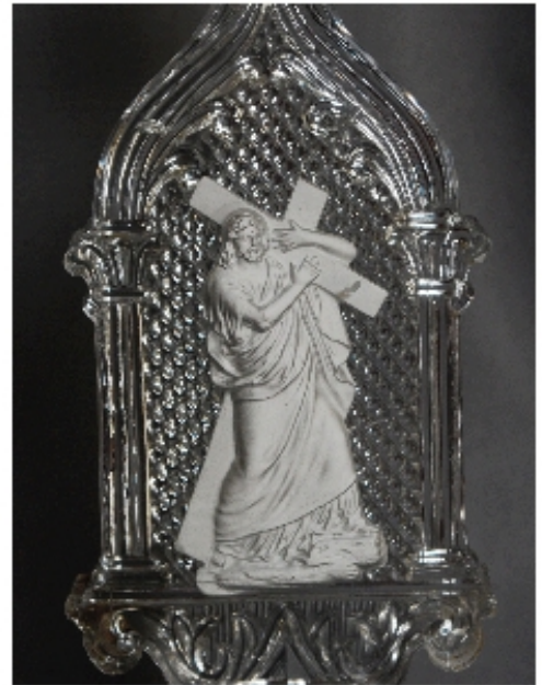
Abb. 2013-4/26-01 Postament mit eingeglaster Paste „Christus mit Kreuz“ gepresstes Bleikristall, H bis Bruch 17,2 cm, Fuß B 6,8 x 6,8 cm Sammlung Vogt PV 698, T 1,4 cm s. MB Launay, Hautin & Cie., um 1840, Planche 55 Pièces diverses, No. 1909, B., Colonne forme Gothique m. Diamants avec Camée [Paste], Baccarat ab 1840