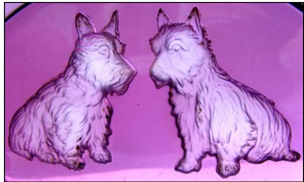
Abb. 2014-2/38-04 (Maßstab ca. 100 %)

Aschenschale mit negativem Relief „Zwei Hunde“, violettes Pressglas, H 3 cm, B 9 cm, L 13 cm, geätzte Marke „Tchécoslovaquie“ Sammlung Kuban