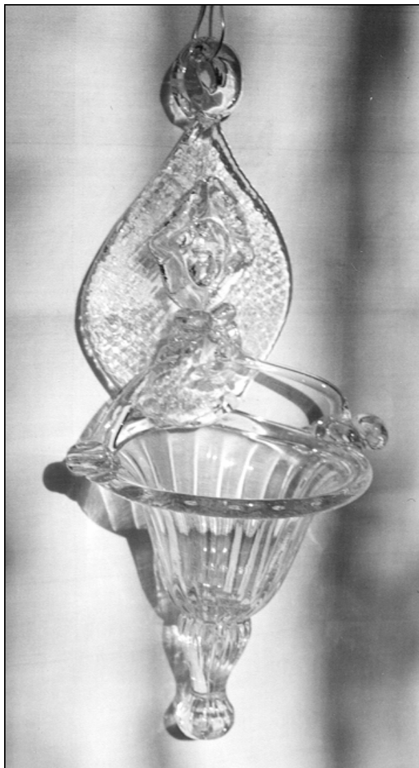
Abb. 2001-2/191 Zwei Weihwasserbecken, H 30 cm Leopold Riedel, Isergebirge, 1750 bis 1800 Sammlung Museum für Glas, Jablonec [Gablonz] aus Riedel 1991, S. 22