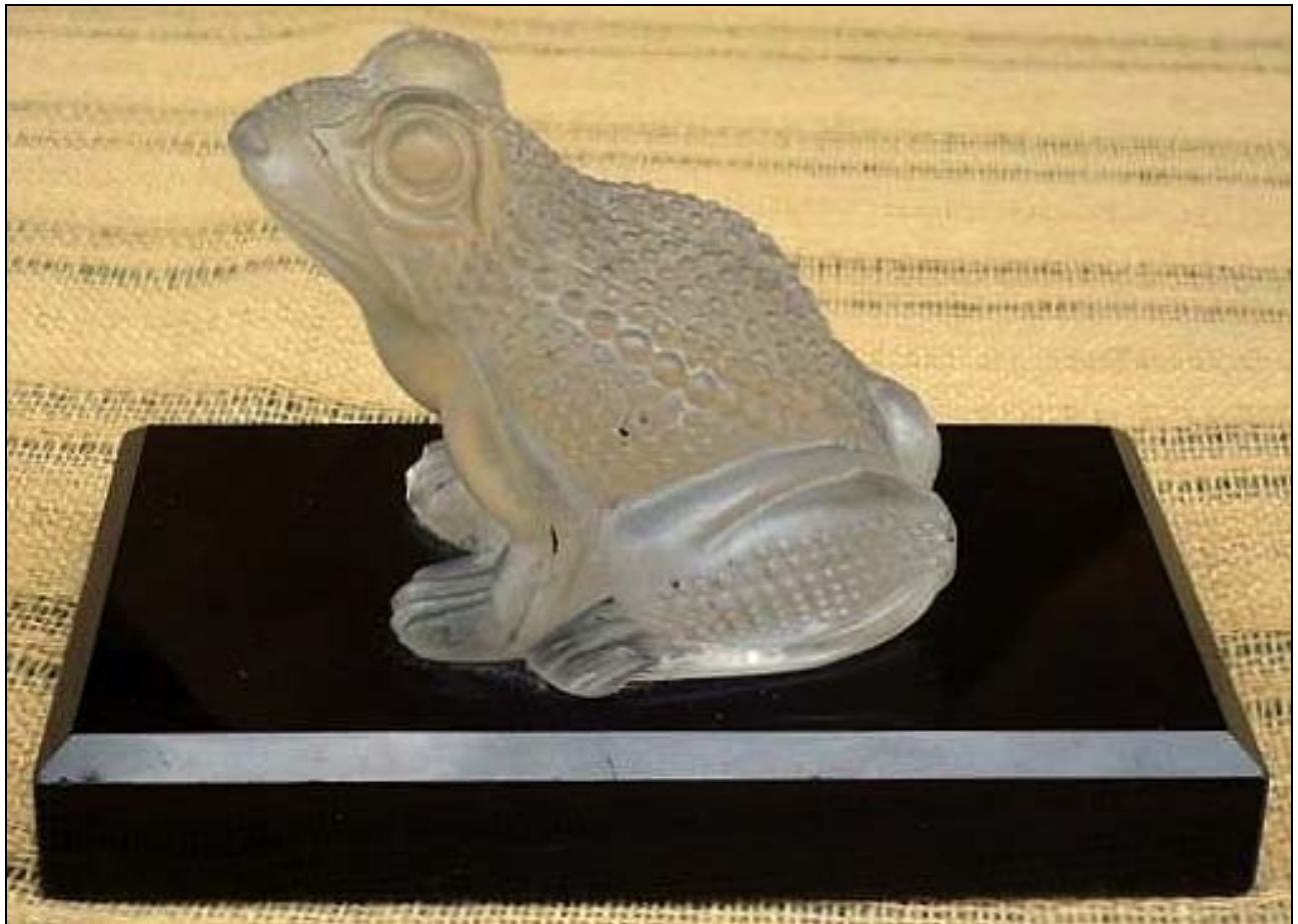
Abb. 2014-3/45-01 Frosch (oder Kröte), farbloses Pressglas, mattiert, opak-schwarzer Sockel, mit Sockel H ca. 7 cm, B 6 cm, L 10 cm Sammlung Kuban vgl. MB Riedel 1885, Tafel 145, Frosch Nr. 576 oder Nr. 579