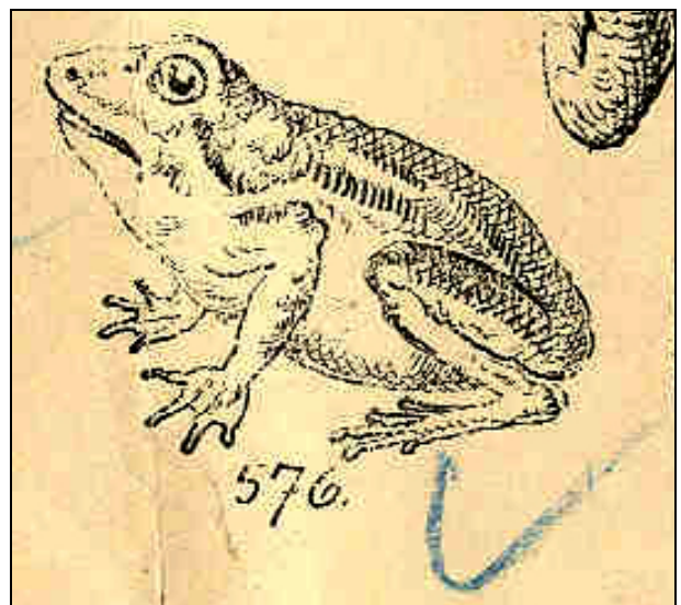
Abb. 2005-3-01/106 (Ausschnitt) MB Riedel 1885, Tafel 145, Figuren Nr. 576 und Nr. 579, Kröte oder Frosch Sammlung Glasmuseum Jablonec nad Nisou ehemals Archiv Ornela