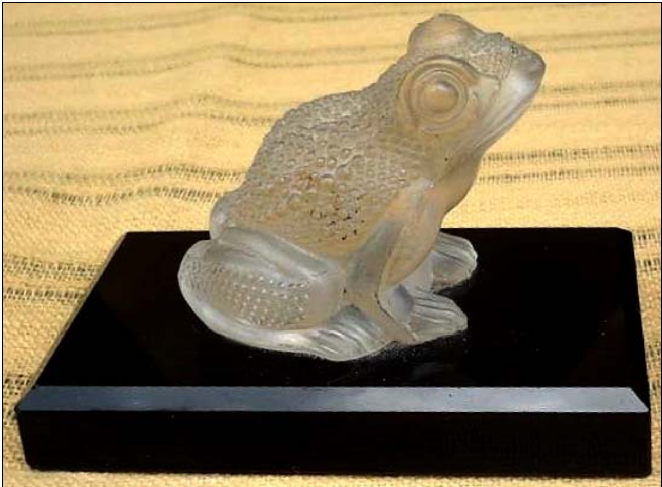
Abb. 2014-3/45-02 Frosch (oder Kröte), farbloses Pressglas, mattiert, opak-schwarzer Sockel, mit Sockel H ca. 7 cm, B 6 cm, L 10 cm Sammlung Kuban vgl. MB Riedel 1885, Tafel 145, Frosch Nr. 576 oder Nr. 579

Die Kröte galt bis ins Mittelalter als hässlichstes Tier der Schöpfung (vgl. 3. Buch Mose 11, 29). Sie liebt feuchte, dunkle Orte und misst die Erde mit ihren Beinen, da sie nicht teilen will. Sie kann den Teufel verkörpern, aber auch einen schützenden Hausgeist . Es existiert keine klare Unterscheidung zwischen der Kröte oder Unke und dem meist männlich gedachten Frosch , im Erzählgut besteht auch eine enge Affinität zur ebenfalls giftigen Schlange (siehe Grimms Kinder- und Hausmärchen 105, Märchen von der Unke, auch KHM 13, 29, 63, 107a, 127, 135, 145, 165, 181). Sie fand in Hexensalben wie auch in der Volksmedizin Verwendung. Man stellte sich den weiblichen Uterus als Kröte vor, die im Körper auf- und abhüpfen konnte (Hysterie). In der Homöopathie wird Bufo rana bei geistiger Benommenheit mit Migräne und Krämpfen verwendet.