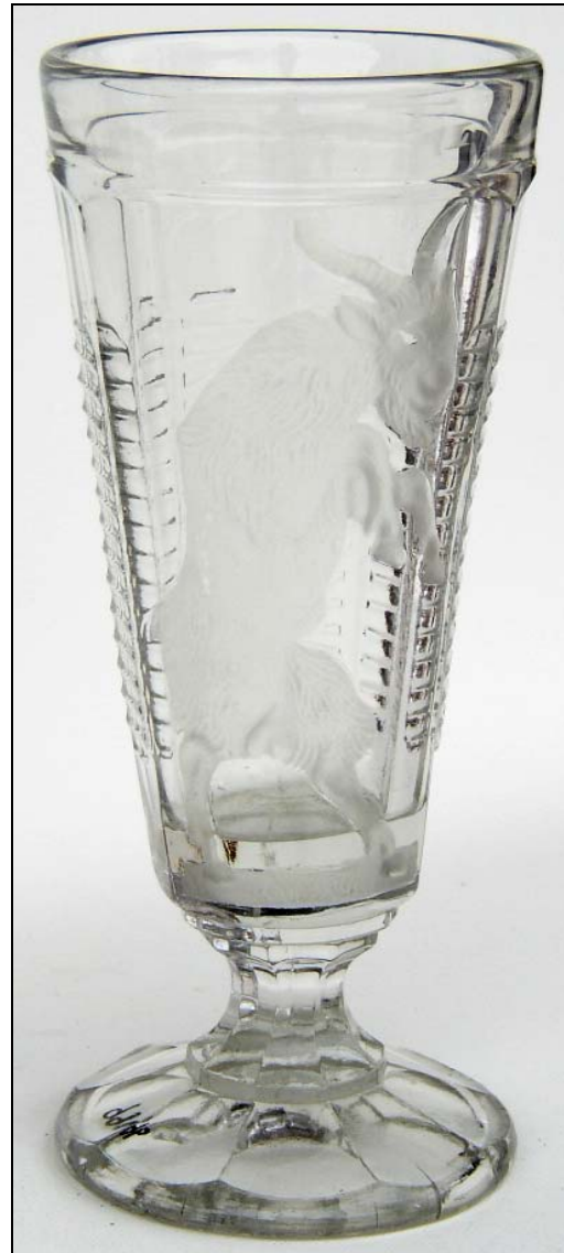
Abb. 2006-1/181 Fußbecher mit aufgerichtetem Ziegenbock Neben-Motiv senkrechte Flächen mit wagrechten Rillen farbloses Pressglas, Relief mattiert, H 18,5 cm, D 7,8 cm Sammlung SG PG-996 s.a. Sammlung Billek, Abb. 1999-2/108 Hersteller unbekannt, Böhmen / Mähren, um 1900