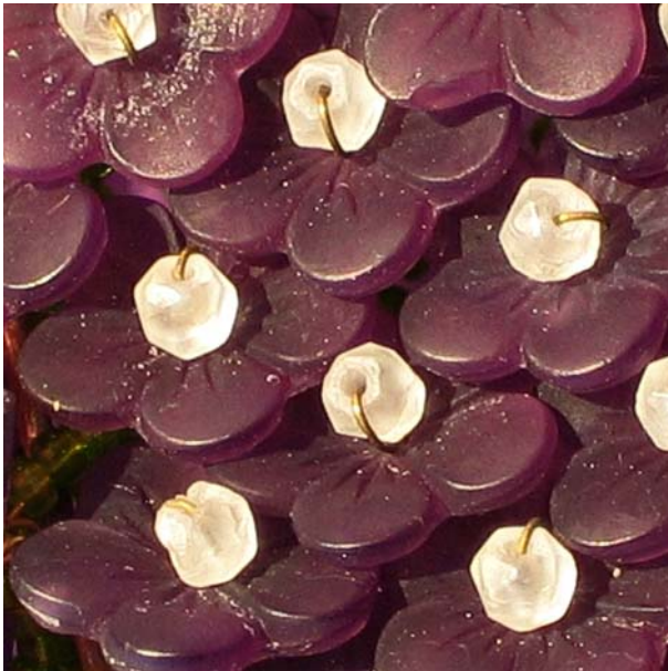
Abb. 2014-4/25-02 Lampenschirm aus gepressten Blüten und Perlen H 14 cm, D max 9 cm, Blüten D 1,5 cm, H/Dicke 1,5 mm Sammlung Jeschke Hersteller unbekannt, Nordböhmen, 1920-er Jahre?

Am offenen Teil des Gebildes befinden sich auf einem (ich würde sagen: Messing-)Draht ring drei wie verbogen wirkende, aber völlig gleich gestaltete Halterungen / Aufhängevorrichtungen aus Messing. Im Inneren ist auf halber Höhe ein stabilisierender Querring angelötet, den Abschluss an der Spitze bildet eine kleine, innen an den 6 Längsstreben angelötete Messingkappe.