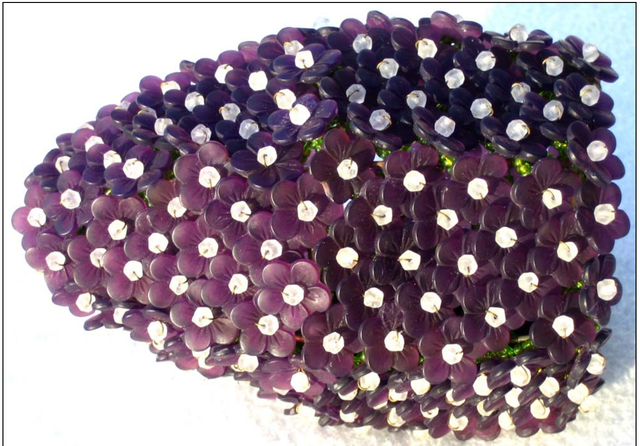
Abb. 2014-4/25-01 (Maßstab ca. 125 %) Lampenschirm aus gepressten Blüten und Perlen, H 14 cm, D max 9 cm, Blüten D 1,5 cm, H/Dicke 1,5 mm, Perlen D 4 mm Sammlung Jeschke, Hersteller unbekannt, Nordböhmen, 1920-er Jahre?