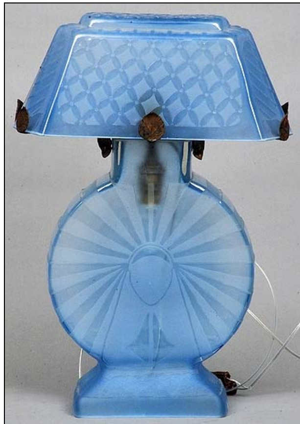
Abb. 2014-4/05-03 Tischlampe hellblaues, form-geblasenes Glas, teilweise mattiert, H 42 cm signiert „F. Léger“ Hersteller unbekannt, Frankreich, 1930-er Jahre

Tattersalls' Sale Ring, Newmarket, Suffolk CB8 9AY, United Kingdom Rowley's Fine Art Auctioneers & Valuers Fine Art and Antiques Lot 896 – A Continental Art Deco glass table lamp . The body with sunburst decoration, the shade with further geometric decoration and signed F. Léger , sup- ported on a leaf cast mount. high 42 cm. Estimate: £ 100 - £ 150