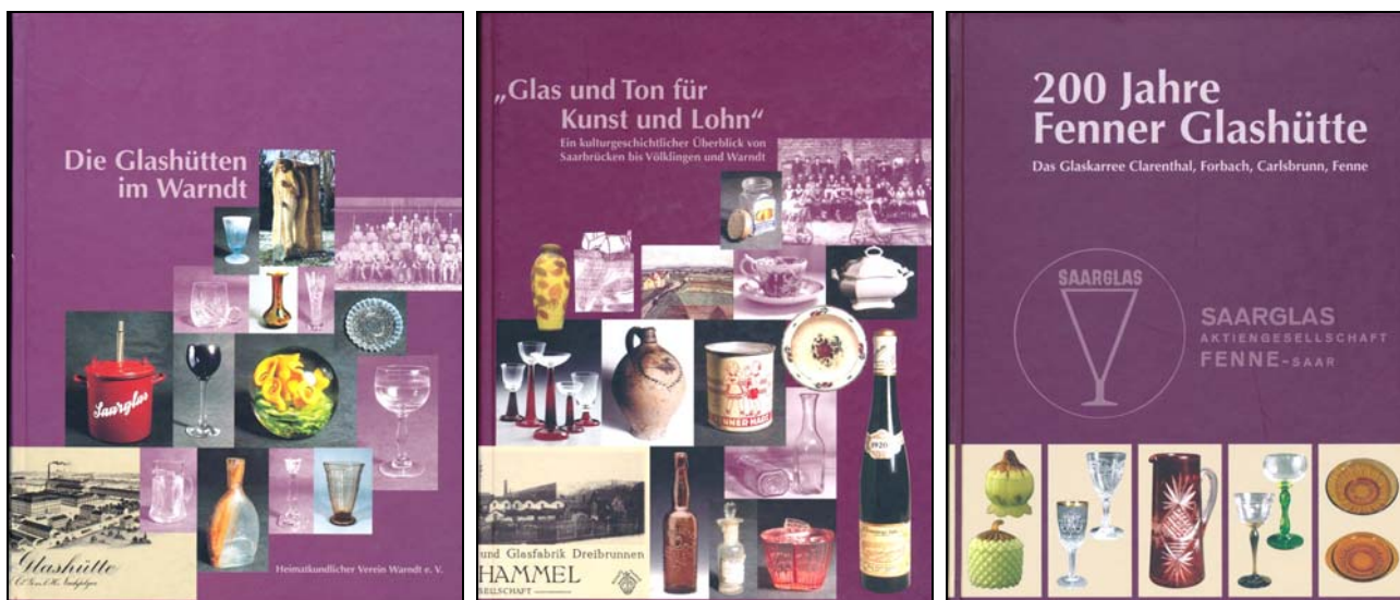
Abb. 2014-3/50-01 Nest u.a., HVW, Die Glashütten im Warndt, Völklingen - Ludweiler 1999, vollständig vergriffen Nest u.a., HVW, „Glas und Ton für Kunst und Lohn“, Saarbrücken - Völklingen 2001, vollständig vergriffen (s.u. Nachdruck) Nest u.a., HVW, 200 Jahre Fenner Glashütte - Das Glaskarree Clarenthal, Forbach, Carlsbrunn, Fenne, Saarbrücken - Völklingen 2014

SG: Die Buchbesprechung in Pressglas-Korrespondenz 2014-3 wurde in drei kostenlos verteilten Wochenblättern von Gerlingen, Klarenthal und Völklingen im Saarland teilweise abgedruckt.