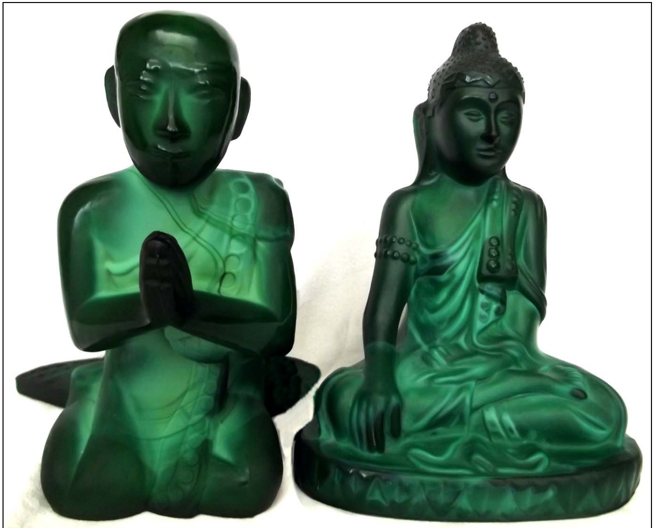
Abb. 2015-1/44-01 Betender buddhistischer Mönch, opak-jade-grünes Pressglas, H 17 cm, B 15 cm, T 15 cm Figur des Buddha auf ovalem Sockel, Hersteller unbekannt, Tschechoslowakei, nach 1948?, ehemals Schlevogt, Jablonec n. N. 1939 Sammlung Gerlach Hersteller unbekannt, Tschechoslowakei, nach 1948?