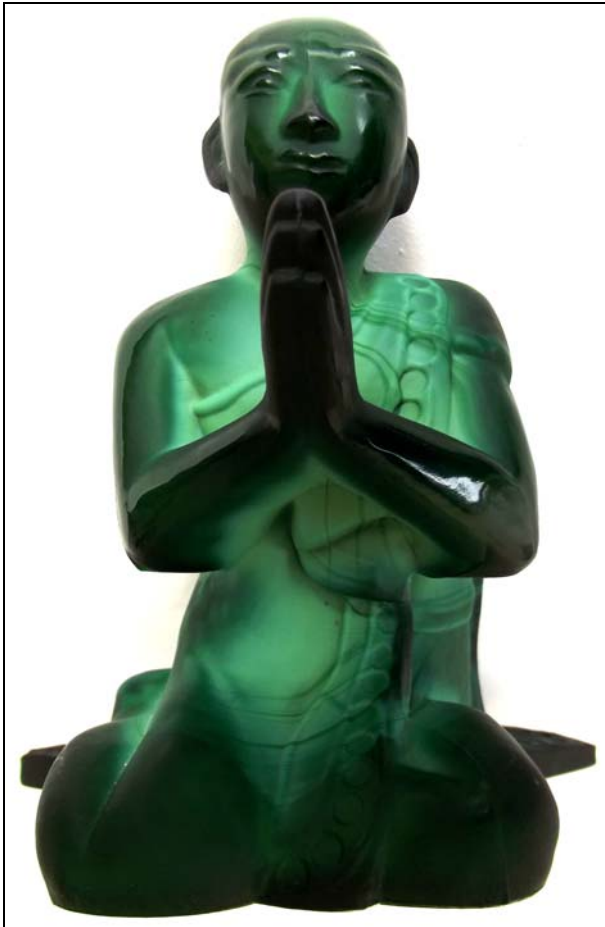
Abb. 2015-1/44-02 Betender buddhistischer Mönch opak-jade-grünes Pressglas, H 17 cm, B 15 cm, T 15 cm Sammlung Gerlach Hersteller unbekannt, Tschechoslowakei, nach 1948?