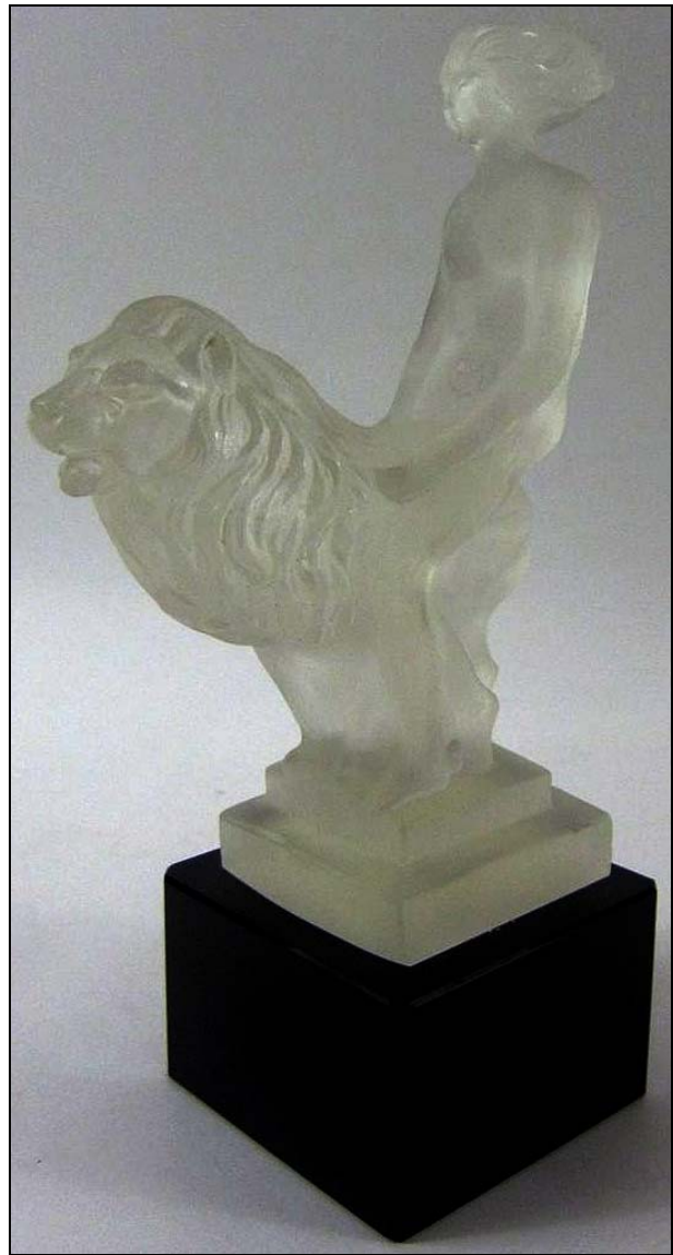
Abb. 2015-1/08-03 Löwe mit Reiterin, farbloses Pressglas, mattiert, opak-schwarzer Sockel, H 21 cm Hersteller unbekannt, Frankreich?, um 1875? aus www.auktionshaus-lueffe.de/ufItemInfo.aspx? a_id=21995&i_id=33357&s_id=2015 (2015-02)

Abb. 2015-1/08-02 (Maßstab ca. 70 %) Löwe mit Reiterin, farbloses Pressglas, mattiert, opak-schwarzer Sockel, H 21 cm Hersteller unbekannt, Frankreich?, um 1930? aus www.lot-tissimo.com/de/i/8754438/p/50/ (2015-02)