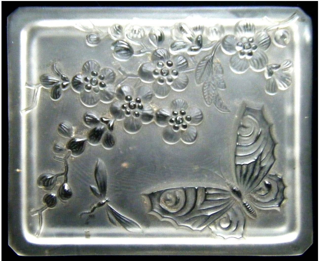
Abb. 2015-3/61-01 und Abb. 2015-3/61-02 (Maßstab ca. 150 %) Deckeldose mit Schmetterling, Libelle und Blütenzweig, farbloses Pressglas, mattiert, H 4,5 cm, B 9 cm, L 11 cm Sammlung Friedrich auf der Unterseite geätzte Rautenmarke „VLG“ Vereinigte Lausitzer Glaswerke AG / VLG Weißwasser O./L., 1935