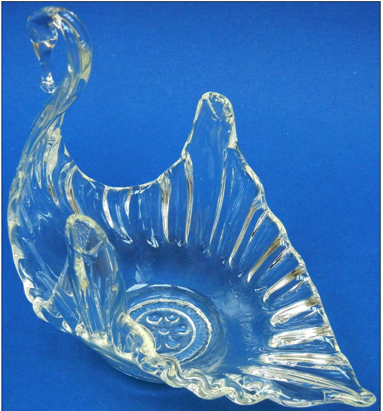
Abb. 2015-3/60-01 (Maßstab ca. 100 %) Schwimmender Schwan als Vase, form-geblasenes, farbloses Glas, H 16 cm, B 9 cm, L 16 cm, im Boden eingepprägtes Motiv Sammlung Reith Hersteller unbekannt, vielleicht um 1900