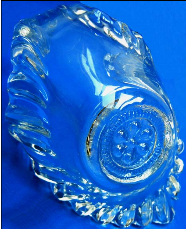
Abb. 2015-3/60-02 Schwimmender Schwan als Vase form-geblasenes, farbloses Glas, H 16 cm, B 9 cm, L 16 cm im Boden eingprägtes Motiv Sammlung Reith Hersteller unbekannt, vielleicht um 1900