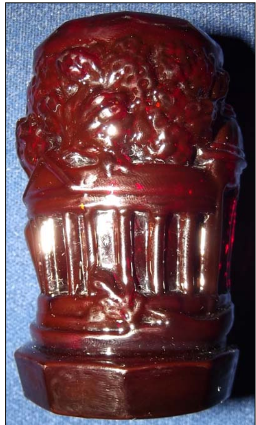
Abb. 2016-2/78-01 rechts (Maßstab ca. 130 %) Rote Vase mit Tempel, im UV-Licht dunkelrot transparentes Pressglas, H 8,5 cm, D 5,5 cm Sammlung Gerlach s. Musterbilder Halama, Tafel 7, Vasen Nr. 1936 / 25356 František Halama, Železný Brod, um 1939