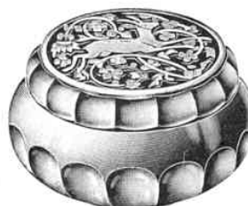
Bonbonnière, 115 mm Ø