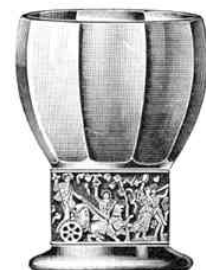
Bowlenbecher, 105 mm hoch