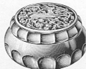
Bonbonnière Nr. 41203 41204 cm 11.5 11.5 m. Reh m. Paradiesvogel