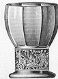
Bowlenbecher Nr. 41206 cm 10.5