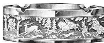
Ascher, achteckig, 150 mm Ø