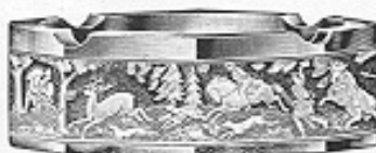
Ascher Nr. 41205 cm 15