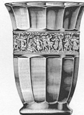
Traubenspüler Nr. 41202 cm 16.5