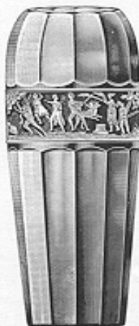
Vase, eingezogen Nr. 41201 cm 20