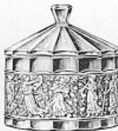
Fuderdose Nr. 41209 cm 9.5