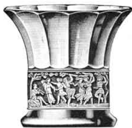
Vase, geschweift 95 mm hoch