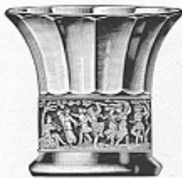
Vase, geschweift Nr. 41200 cm 9.5