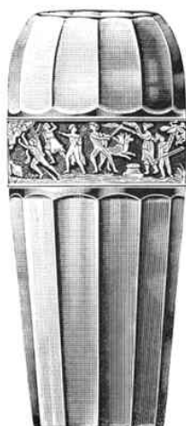
Vase, eingezogen, 200 mm hoch