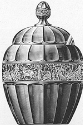
Bowle, Deckel mit Einschnitt ohne Deckel, gerade getrieben, als Blumentopf Nr. 41207 41208 cm 31 31