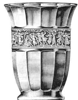
Traubenspüler-Vase, 165 mm hoch