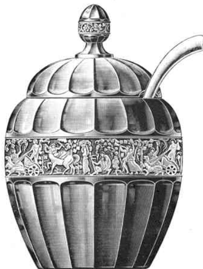
Bowle, mit Einschnitt Löffel weiß