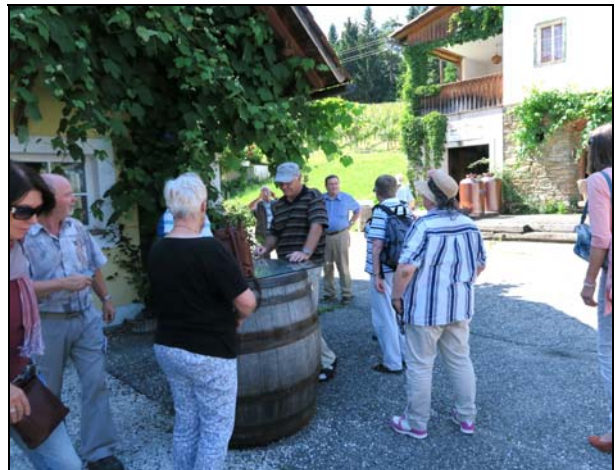
Abb. 2016-2/14-04 Brennerei Jöbstl in Eibiswald