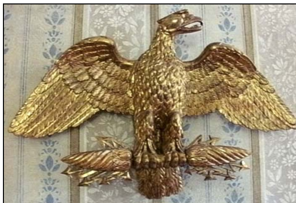
Tschako Napoléon III. Mexiko 1862-1863