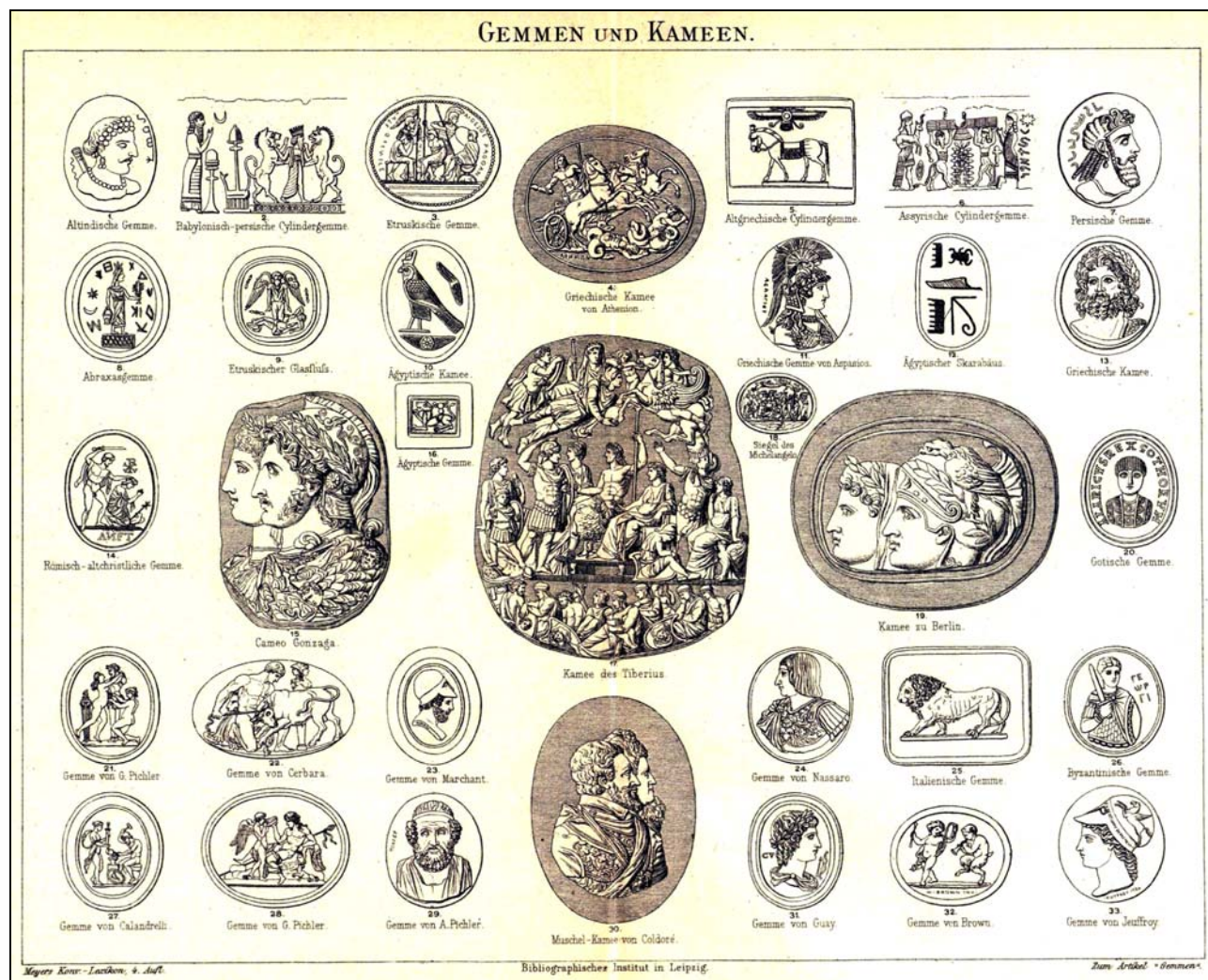
Abb. 2017-2/23-01; Bildtafel „Gemmen und Kameen“, Meyers Konversationslexikon, 4. Auflage, 1885-1892, Band 7