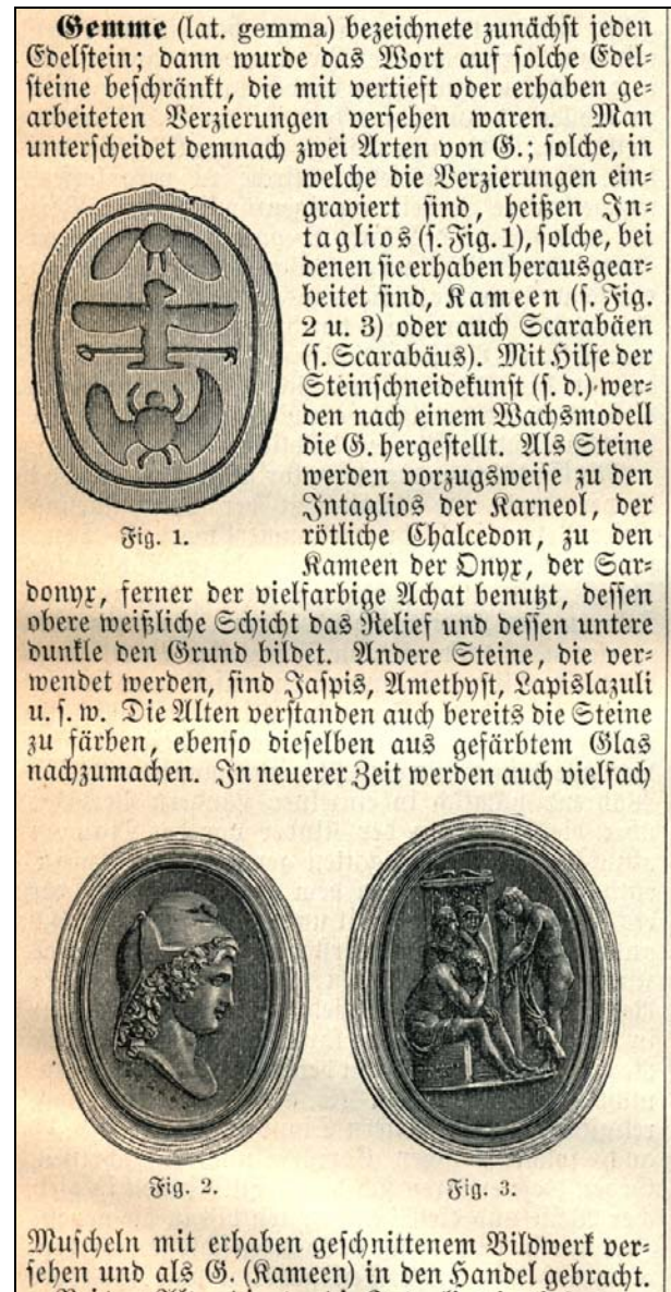
Abb. 2017-2/23-04, Gemme, Brockhaus 1894, Band 7, S. 758