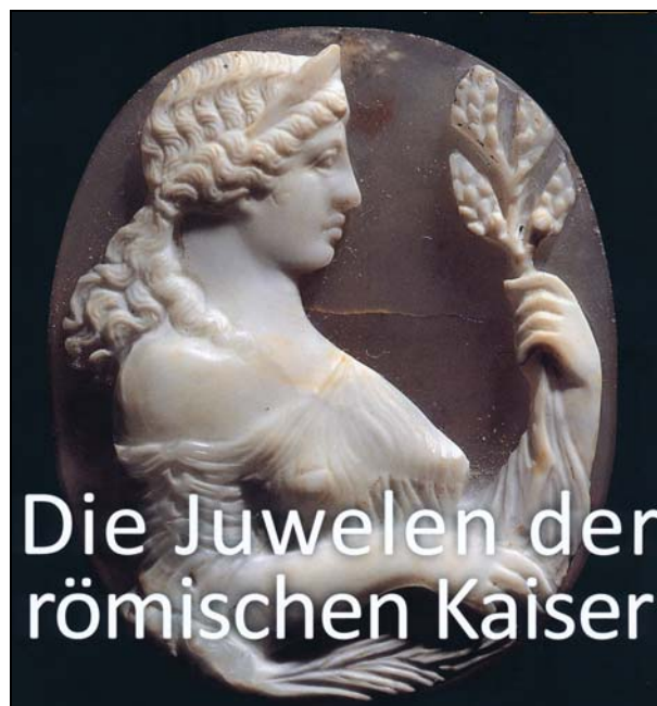
Die Juwelen der römischen Kaiser

Die Kamee einer jungen Frau mit einem Blätterzweig wird in AW 2017-5 als „ Cameo Venus, Stabiae , Museo Nazionale Archaeologico Neapel“ zugeschrieben. Die Villa Anteros & Hercules wurde beim Ausbruch des Vesuv 79 n. Chr. verschüttet. Diese Kamee zeigt schlagartig die Verwandtschaft mit den Pasten des „ Empire “ in Frankreich, als Napoléon I. Kaiser war. Selbstverständlich ist sie aus einem Lagenstein geschnitten und nicht aus Gips oder Porzellanfritte ... Wichtig an den damit angekündigten Berichten in AW ist der Hinweis auf die politische Bedeutung solcher Steine in der Antike: der berühmte „ Ptolemäer-Kamee “ aus einem Sardonyx , entstanden 278-269 v. Chr. , sollte während der Herrschaft von König Ptolemaios II. und seiner Schwester Arsinoe II. von Ägypten (reg. 308-246 v. Chr.) für seine Glück bringende Herrschaft zeugen und Reklame machen, obwohl ihn die gewöhnlichen Ägypter nie zu sehen bekamen. Kaiser Augustus hat diesen Kameo 30 v. Chr. zusammen mit dem Schatz der Königin Kleopatra VII. erbeutet und nach Rom gebracht. Schließlich ist er im Kunsthistorischen Museum / KHM in Wien gelandet.