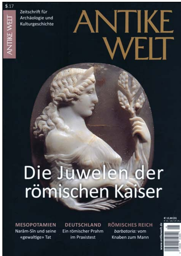
Abb. 2017-2/23-02 Antike Welt 2017-5, Titelbild Kamee „Frau mit Blätterzweig“

Wikipedia DE: Gemme : vertieft geschnittener Schmuckstein bzw. Edelstein. Das Bildmotiv wird in den Stein eingeschnitten: Intaglio .