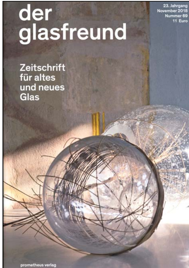
Abb. 2018-1/59-01; Einband der glasfreund, 23. Jahrgang - November 2018, Nummer 69

Titel: Michaela Swade, «I. Gebunden - II. Ungebunden» 2012 LWL-Industriemuseum Glashütte Gernheim Rücktitel: Installation «Frühe Manufakturen in Kassel» Städtisches Museum Kassel.