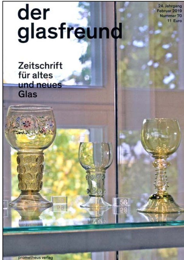
Abb. 2018-1/88-01; Einband der glasfreund, 24. Jahrgang - Februar 2019, Nummer 70