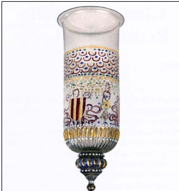
FIG. 1. Glass hanging lamp of cesendello type. Venice or possibly France, façon de Venise, about 1500–1515. H. 34.5 cm, D. 11.6 cm. Collection of Rainer Zietz, London.