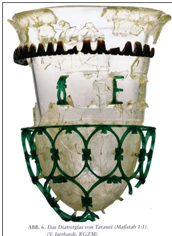
ABB. 6. Das Diatretglas von Taraneš (Maßstab 1:1).

Abb. 2018-1/23-02; Taraneš-Becher Journal of Glass Studies Volume 59 - 2017, S. 106