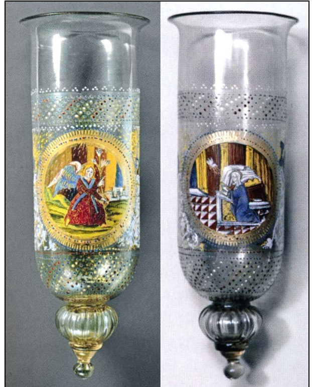
FIG. 2. Glass hanging lamp of cesendello type. Venice, about 1500–1515. H. 36.2 cm, D. 12.5 cm. The Metropolitan Museum of Art, New York (inv. no. 14.83, Rogers Fund, 1914).