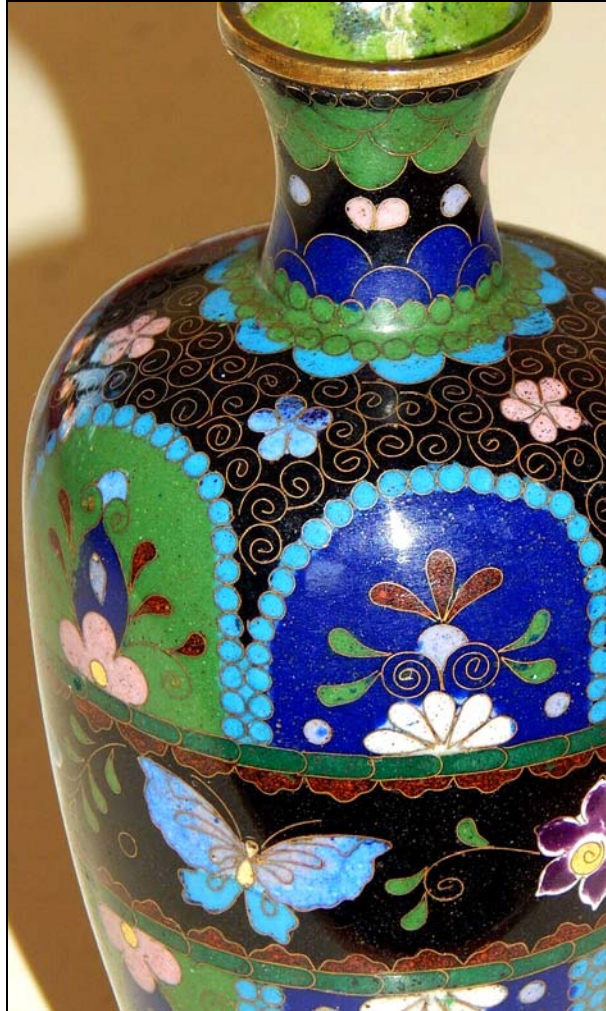
Abb. 2019/44-03 eBay Art.Nr. 273964503856 (2019-08-16) Antike Cloisonne Emaille Vase, Japan, um 1900 H ca. 17.8 cm, D ca. 8.3 cm SG: Hersteller unbekannt, Anbieter DE