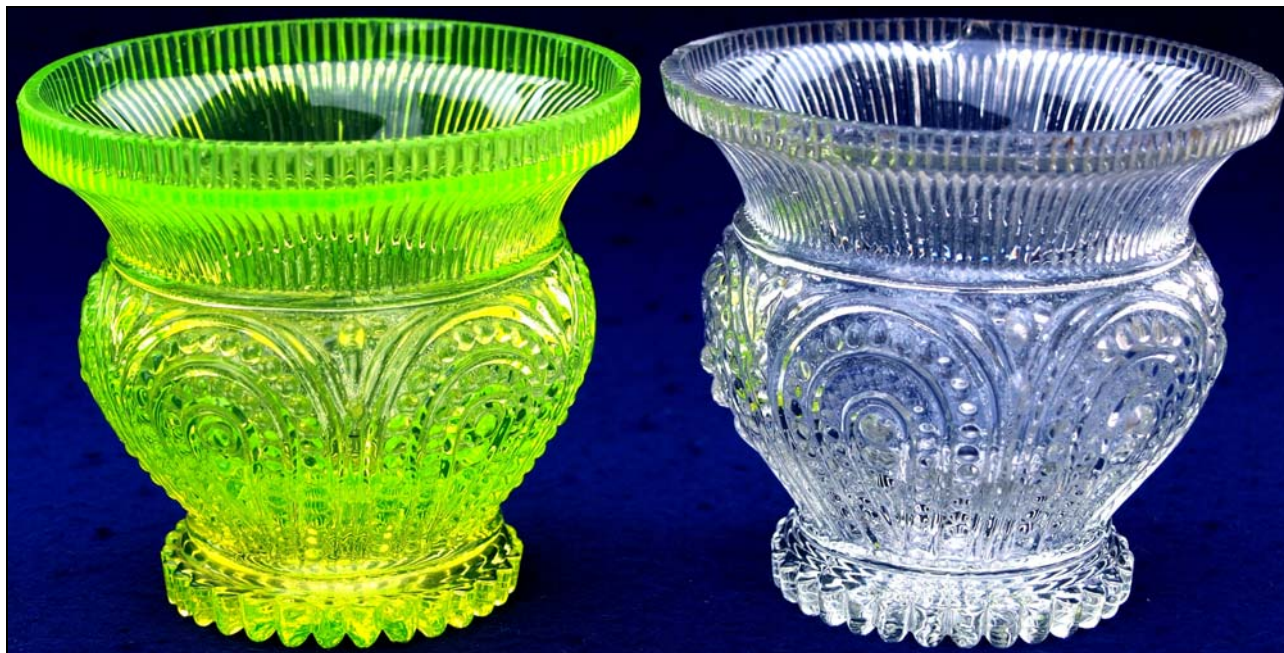
Abb. 2019/36-05 (Maßstab ca. 100 %)

Hersteller unbekannt, wahrscheinlich Steiermark, um 1840