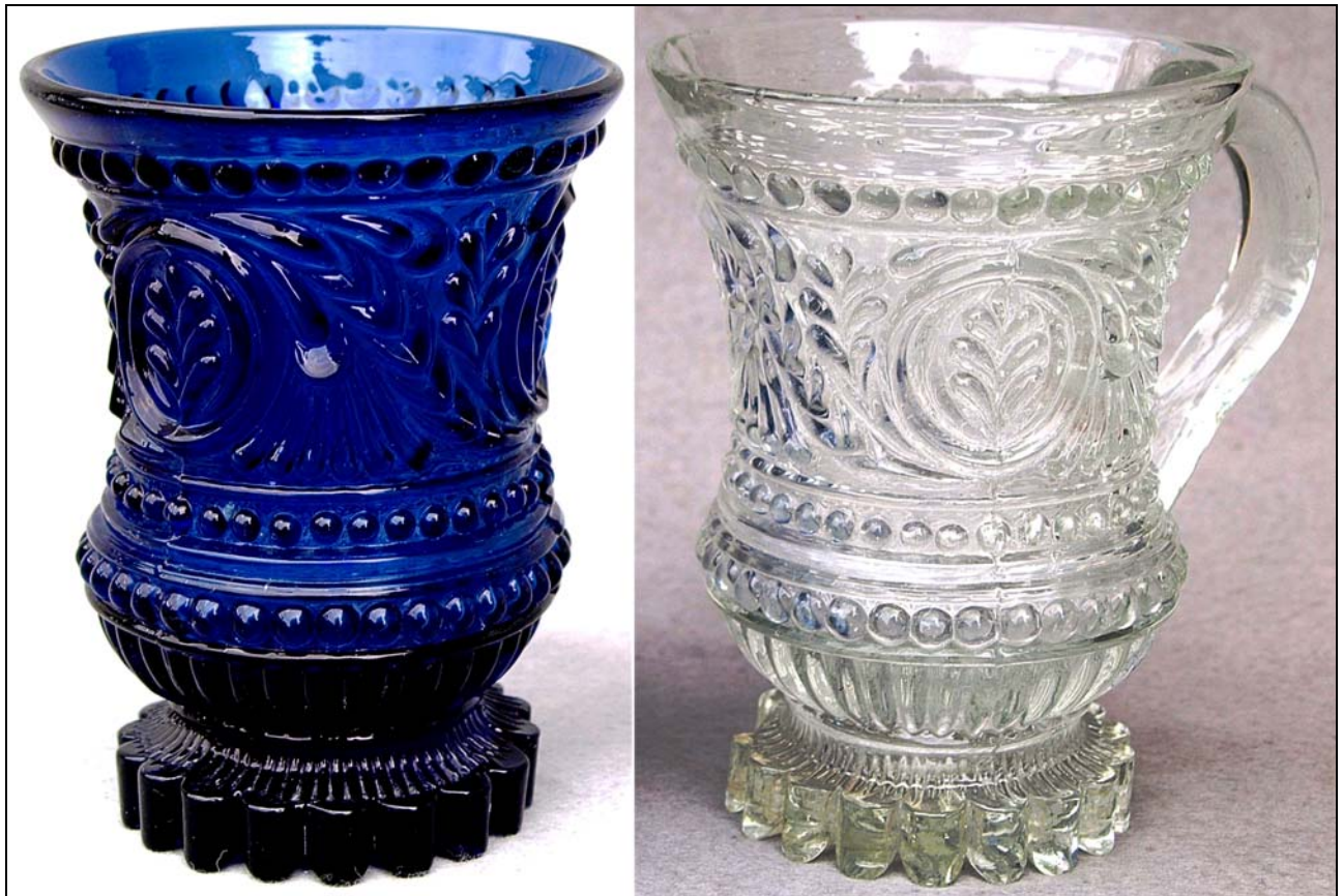
Abb. 2019/36-01 (Maßstab ca. 80 %)

Fußbecher mit 7-blättrigen Zweigen und Perlen-Bändern, kobalt-blaues Glas, H 12 cm, D 9 cm, farbloses Glas H 12,7 cm, D 9,5 cm farbloser Fußbecher mit angeschmolzenem Henkel und Abriss