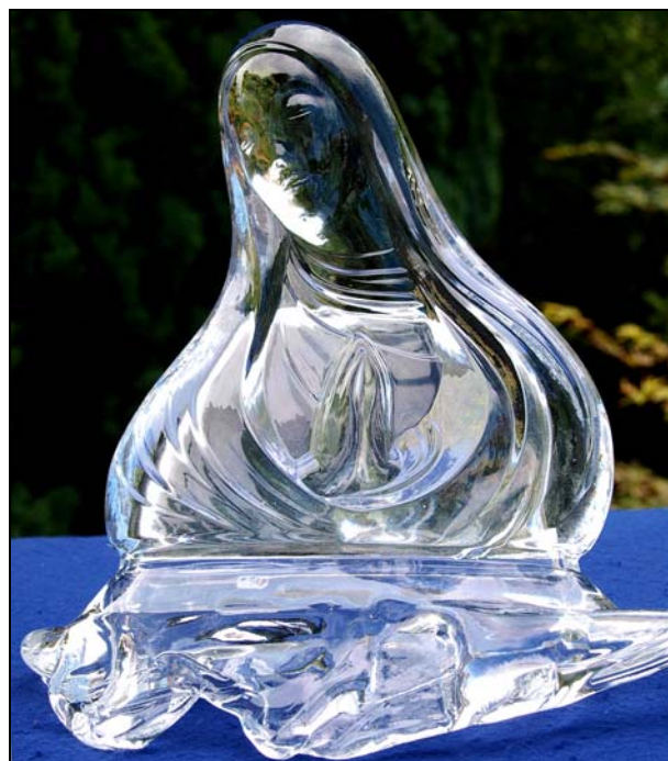
Abb. 2005-4-04/027 MB Schlevogt 1935, Tafel B3 Madonna Nr. 526 mit Leuchtern Nr. 382/386 MB Sammlung Jablonex Group AG / Desná

Die abgesprengten Überstände wurden selbstverständlich als wertvolles Rohmaterial wieder eingeschmolzen und neuerlich verarbeitet.