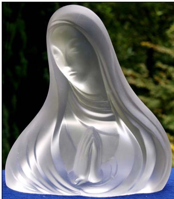
Abb. 2019/29-04 (Maßstab ca. 40 % / 30 %) Madonna MB Schlevogt 1935, Tafel B 3, Nr. 526 Entwurf Franz Hagenauer, Wien Endprodukt L/B/H 18 / 8 / 19,5 cm Rohling L/B/H 25 / 11 / 27 cm

Die abgesprengten Überstände wurden selbstverständlich als wertvolles Rohmaterial wieder eingeschmolzen und neuerlich verarbeitet.