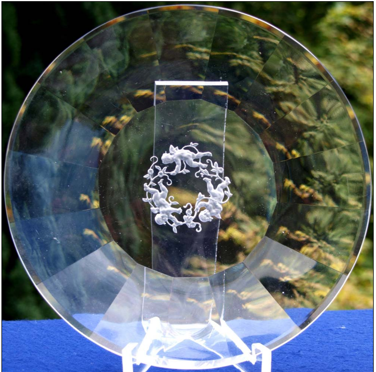
Abb. 2019/29-01 (Maßstab ca. 80 %) Teller mit Puttenreigen und 16 Facetten, farbloses Pressglas, Endprodukt H 2,5 cm, D 19,5 cm / Rohling H 3cm, D 20,7 cm Sammlung Stopfer MB Hoffmann 1927 (1930/1931), Tafel 62, Nr.605 / MB Schlevogt 1939, Tafel 43, Nr.1305