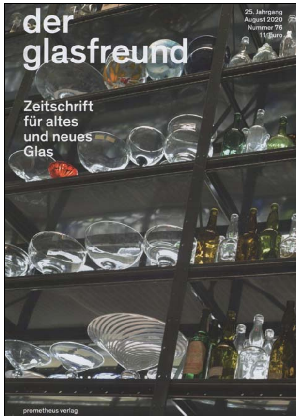
Abb. 2020/76-01, Einband der glasfreund, 25. Jahrgang - August 2020, Nummer 76 Titel: Schaudepot des Holmegaard Værk in Næstwed ... Rücktitel: Glasmacher in der Schauwerkstatt des Holmegaard Værk in Næstwed / Dänemark.

der glasfreund, 25. Jahrgang - August 2020 Nummer 76, 11 Euro